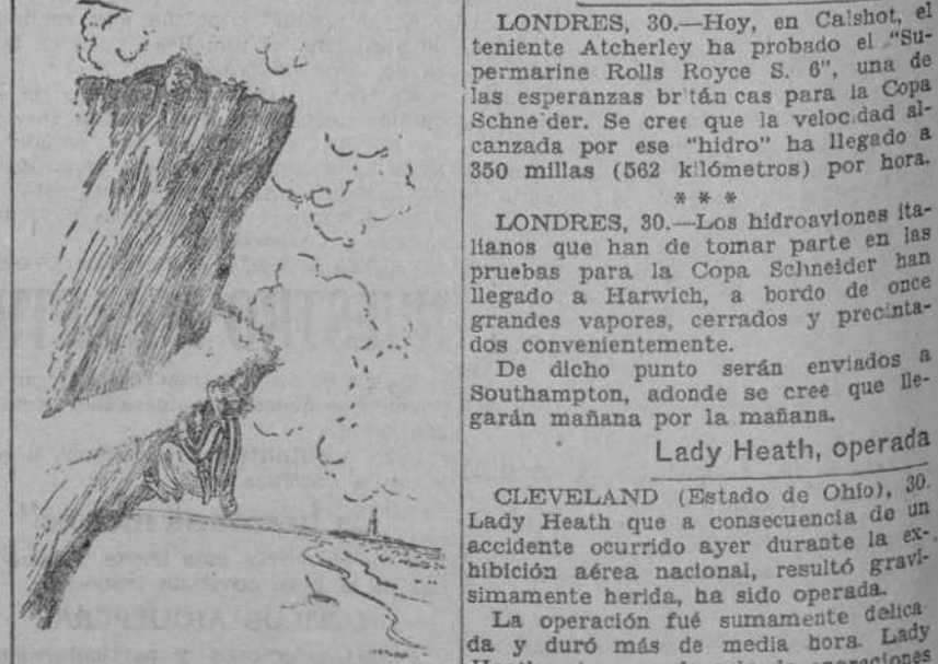
—Esperate ahí a que suba la marea, y yo te recogeré entonces con un bote. ("London Opinion", Londres)