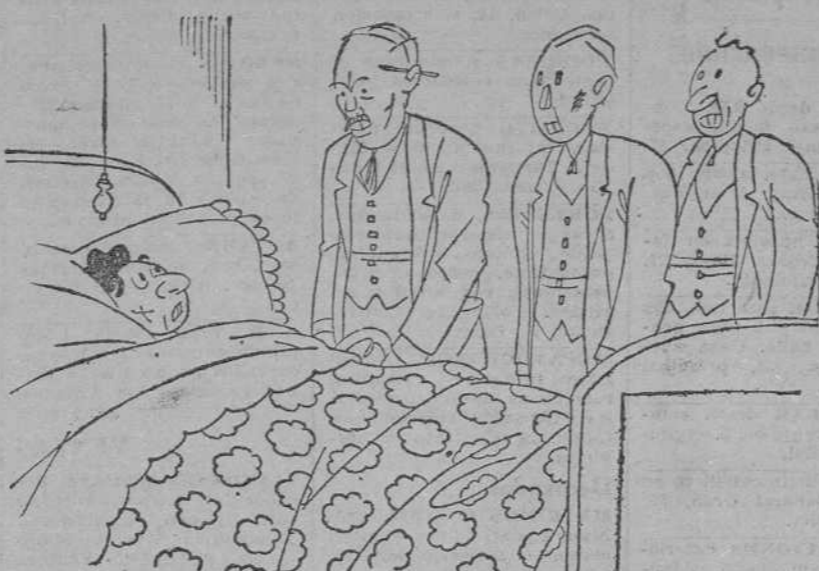
—¿Y en qué sitio le han dado a usted la cornada? —En el Real Sitio de San Lorenzo de El Escorial.