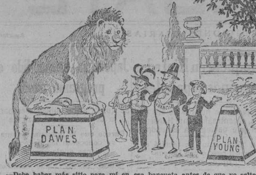
—Debe haber más sitio para mí en esa banqueta antes de que yo salte. ("Western Mail", Cardiff.)