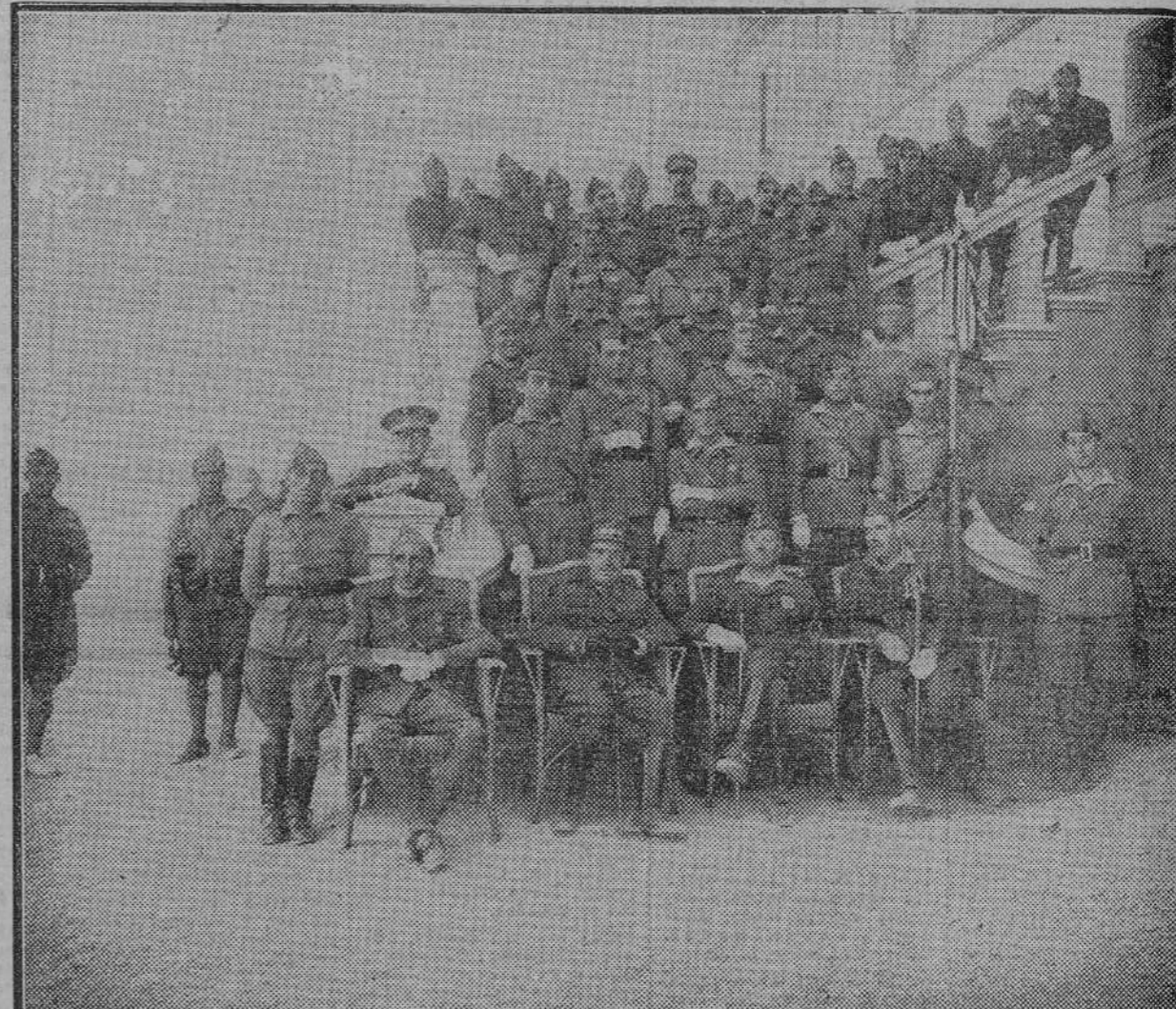
Arriba: El general Millán Astray en el momento solemne de hacer entrega del mando de la Legión al nuevo coronel, señor Liniers, que tan heroicamente actuó en las pasadas campañas de África.—Abajo: Un grupo de jefes y oficiales, presididos por Millán Astray, después de la entrega del mando.