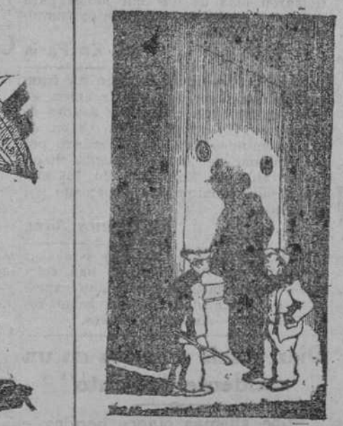
—La combinación la conozco. Lo malo es llegar hasta la cervera. ("Dimanche Illustré", París)