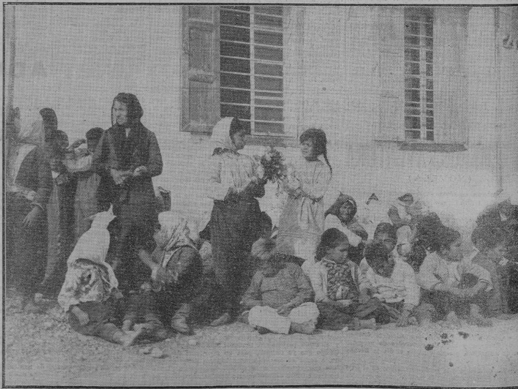
Tipos de judíos de Palestina agrupados en las calles de Jaffa, mientras continúan las luchas en las aldeas, no obstante haber sido relativamente restablecido el orden en Jerusalén.