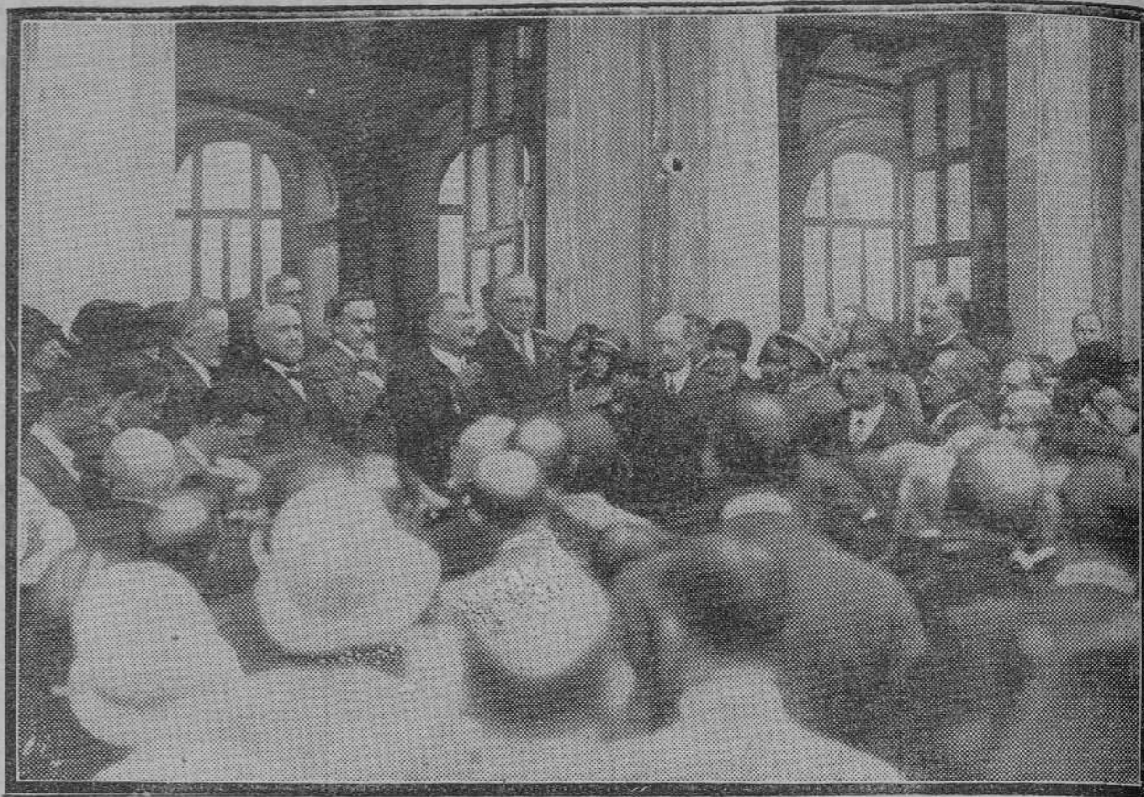
Momento de inaugurarse las Escuelas "Primo de Rivera", a cuyo acto asistieron el presidente del Consejo y el ministro de Instrucción pública.