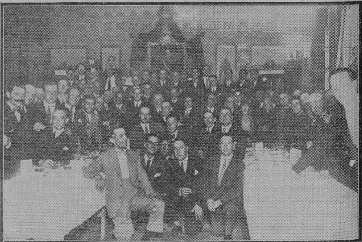
Los asambleístas de las Jornadas Médicas Gallegas reunidos en la Diputación provincial de La Coruña, donde se celebró la recepción y fueron obsequiados con un espléndido "lunch".