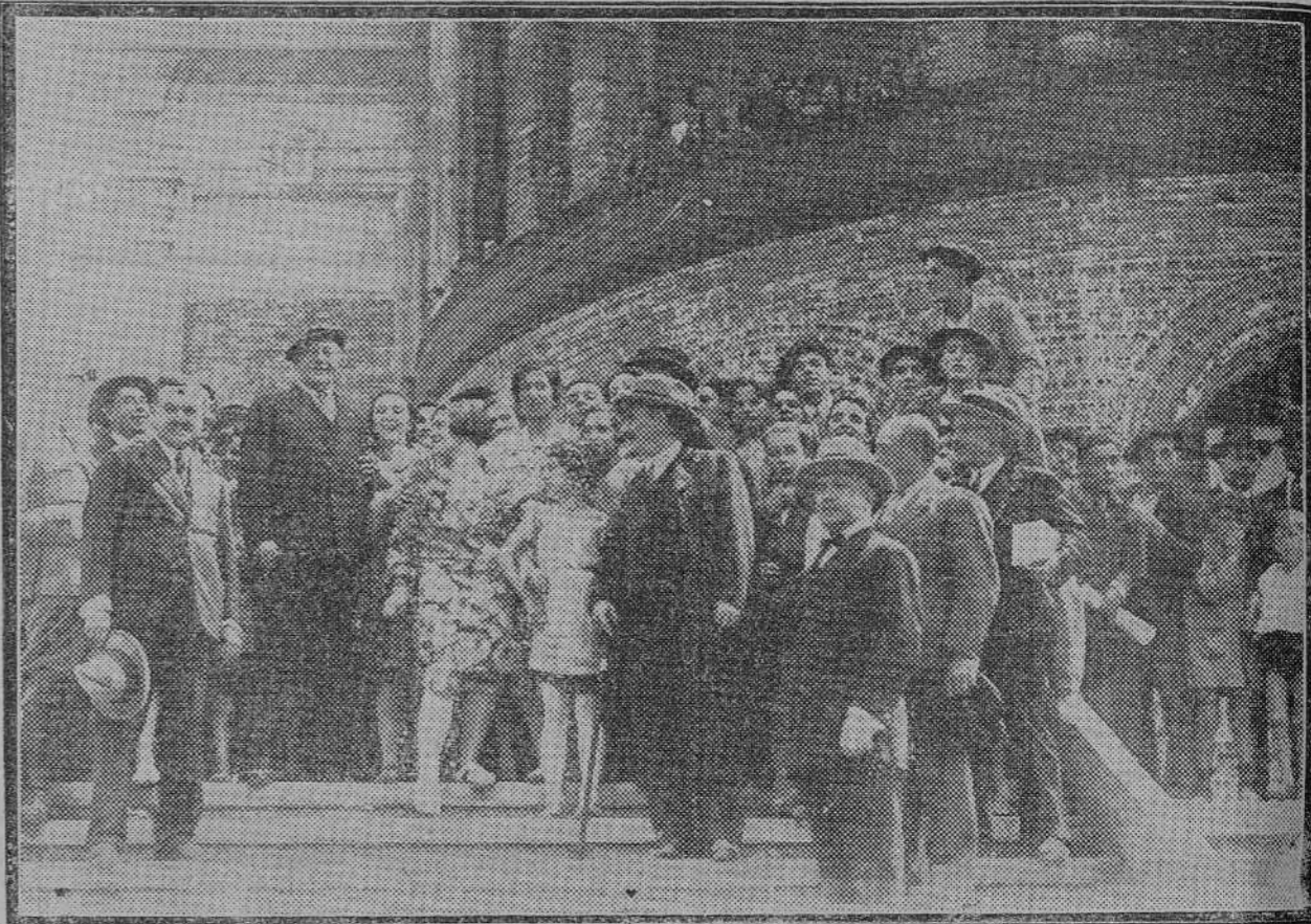
El presidente del Consejo, calada la clásica boina, inaugura el nuevo Mercado de Bilbao.