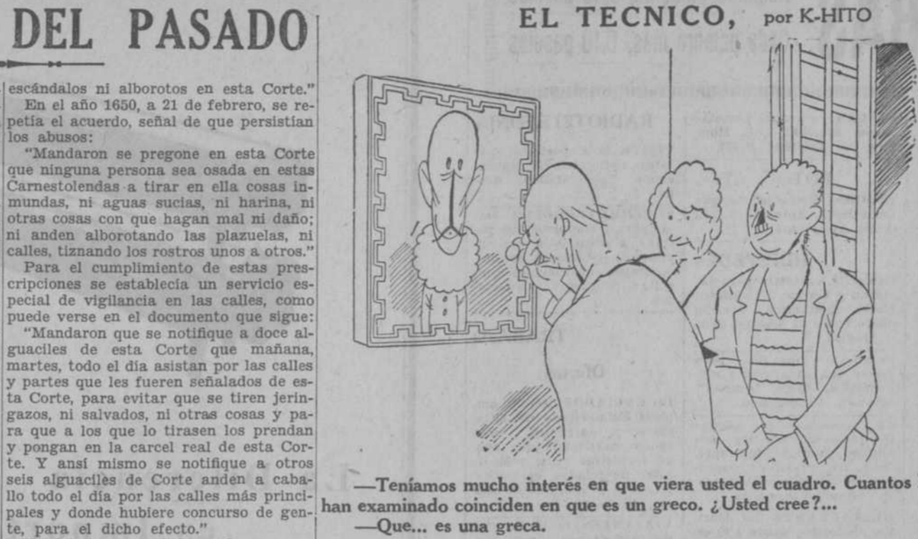
—Teníamos mucho interés en que viera usted el cuadro. Cuantos lo han examinado coinciden en que es un greco. ¿Usted cree?... —Que... es una greca.