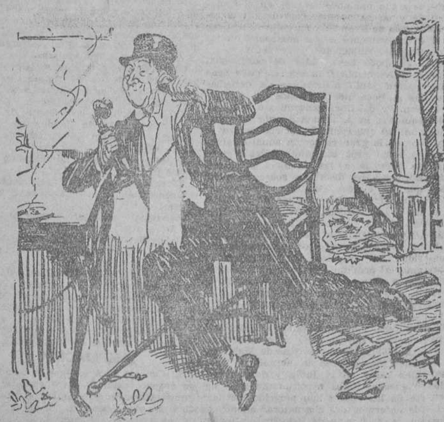
EL TRASNOCHADOR.—Oiga. ¿Informaciones? ¿Quiere decirme la hora exacta?... Las cuatro y veinticinco... Gracias (pausa)... ¡Ah! ¿Podría decirme también qué hora es? ("The Passing Show", Londres.)