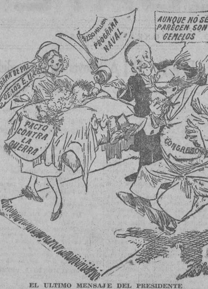
EL ULTIMO MENSAJE DEL PRESIDENTE ("New York Herald Tribune").