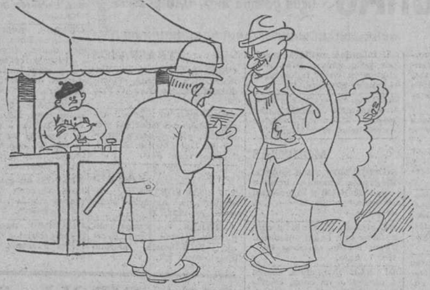
—Conforme; ahí van los dos duros, pero póngame usted el número en el recibo. —¡Bah! ¡Bah! ¿Pero usted es de los que creen en la lotería?