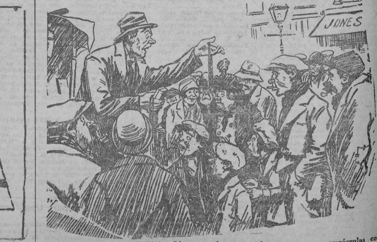
EL VENDEDOR CALLEJERO.—Lleven ustedes estas perlas a su casa y compárenlas con unas buenas... Si encuentran ustedes alguna diferencia, tráiganlas y se les devolverá el dinero. ("London Opinion", Londres.)