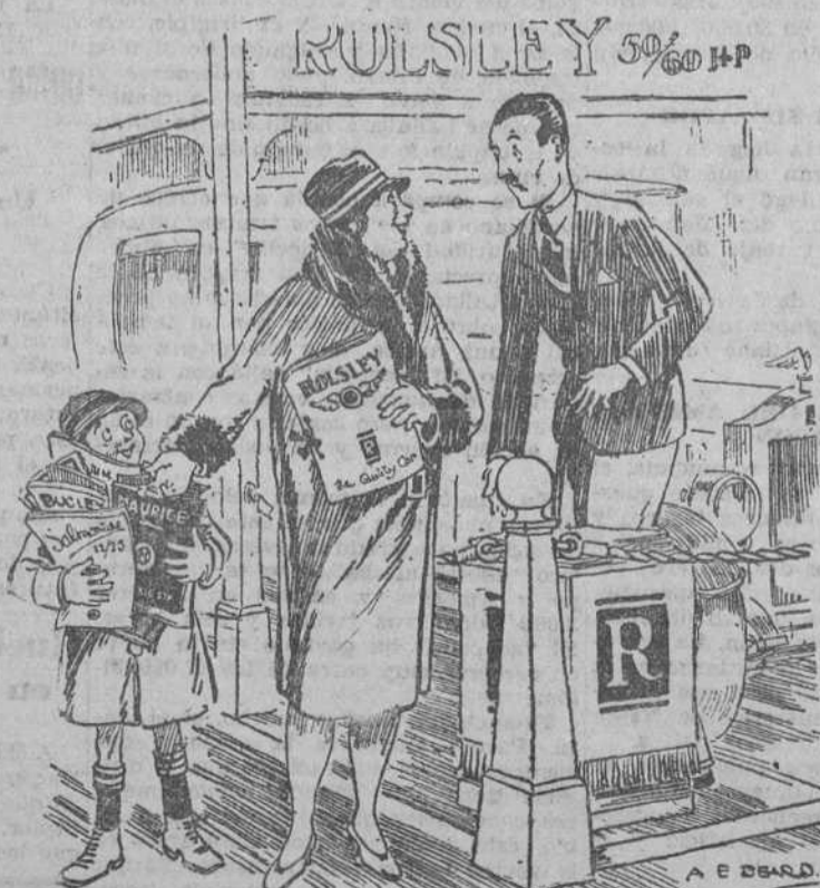
LA SEÑORA (que ha ido a pedir catálogos).—Muchas gracias. Porque mi niño los está coleccionando para su álbum de recortes.