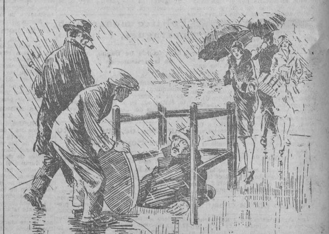
EL POCERO.—¿Se puede saber por qué has puesto la tapa estando yo dentro? EL APRENDIZ NOVATO.—Como vi que empezaba a llover..., para que no se mojara usted.