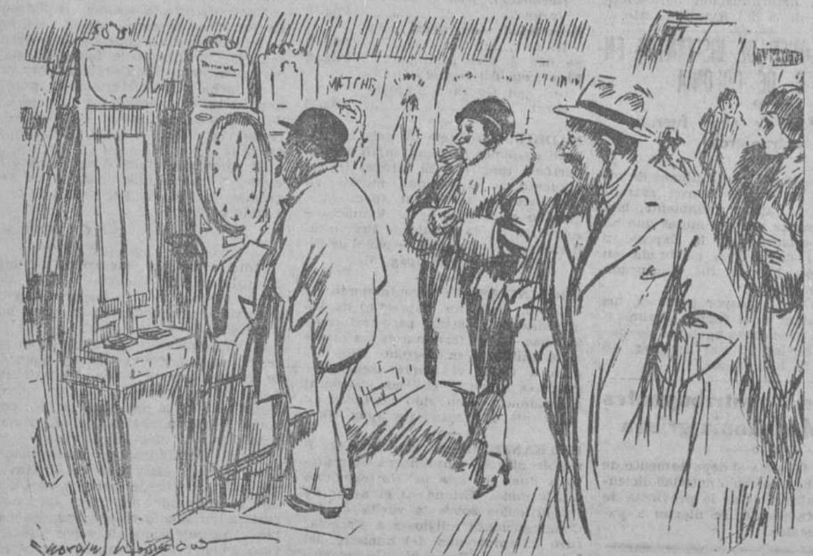
—Nada; lo que te digo: estas básculas están siempre mal. Me he quitado el gabán y marca el mismo peso.