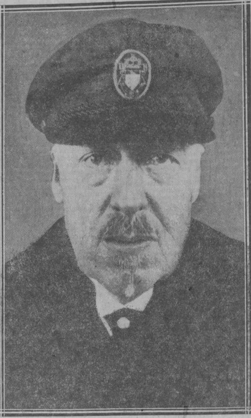
El doctor Hugo Eckener, bajo cuya dirección se ha construido el dirigible "Conde de Zeppelin", que ha realizado anteaer el cuarto vuelo y que realizará a breve un viaje a América

Anteaer ha realizado el "Conde de Zeppelin" el cuarto vuelo, con la particularidad de haber probado el gas azul y haber llevado ya setenta pasajeros, entre ellos el presidente del Reichstag, Loebe. Al doctor Eckener se debe principalmente este nuevo éxito del famoso dirigible. Director de la casa Zeppelin, fue encargado durante la gran guerra de la enseñanza de los pilotos. En el mar del Norte mandó una Escuadra de zeppelins. Eckener es el piloto de dirigibles más antiguo del mundo y el que mayor número de vuelos ha realizado. El más importante fué el que efectuó en octubre de 1924, pilotando el dirigible "R. III", desde Alemania a Nueva York. Ahora, tras estos vuelos preliminares, realizará un ensayo a Norteamérica.