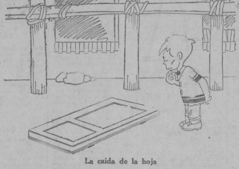
La caída de la hoja