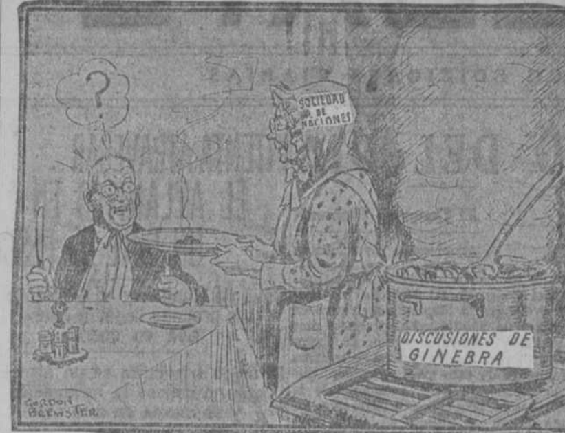
LA RACION ES MUY ESCASA ("Dublin Evening Herald").

cogieron entre los escombros y otro viajero que falleció en Linares a consecuencia de las heridas. Los heridos pasan escasamente de veinte, añadió el conde de Guadalhorce.