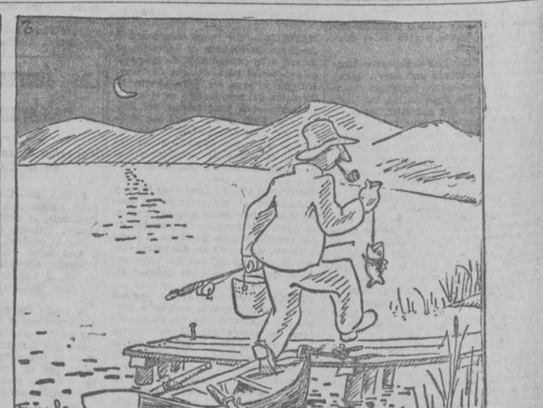
"El sueño de un pescador que en esta apartada orilla..."

(Historieta de Fruech, en "Life", Nueva York.)