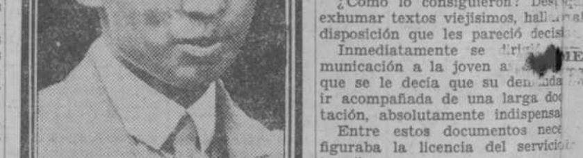
El príncipe Chichibu es la primera vez que un hijo de Reyes del Japón contrae matrimonio con una señorita que no pertenece a una de las señoras familias de la aristocracia a las que estaba reservado ese privilegio.

Desde hace más de tres mil años esta es la primera vez que un hijo de Reyes del Japón contrae matrimonio con una señorita que no pertenece a una de las señoras familias de la aristocracia a las que estaba reservado ese privilegio.