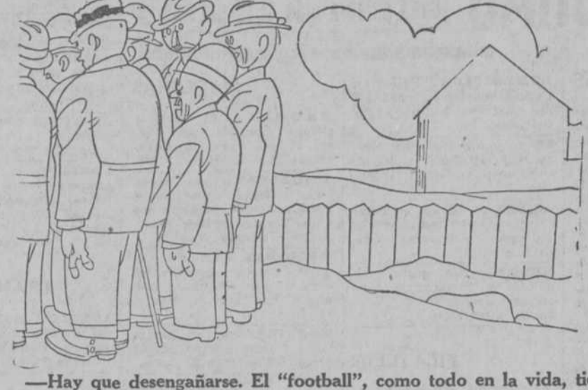
—Hay que desengañarse. El "football", como todo en la vida, tiene sus altas y sus bajas. —¡Pronto! ¿Cuántas son las bajas?