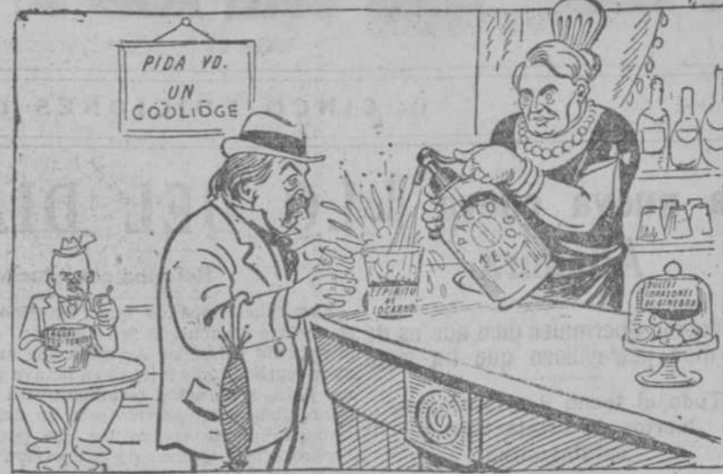
BRIAND.—Basta, señora: le he pedido un poco de seltz y me ha echado usted las cataratas del Niágara. (The Daily Express, Londres.)