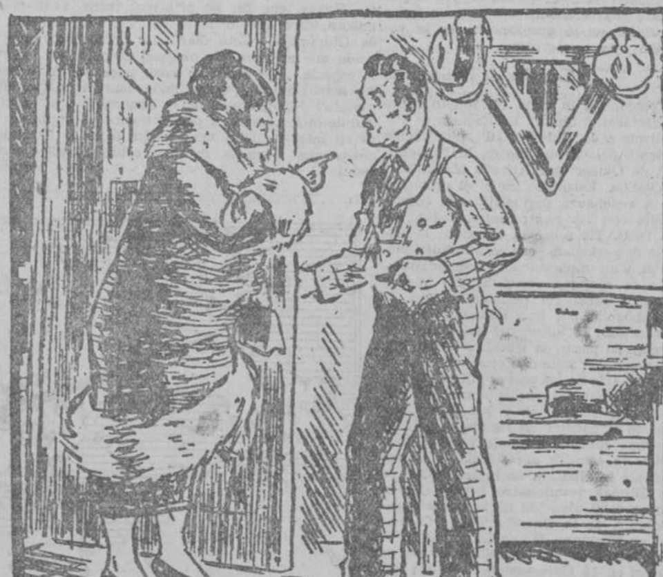
EN EL PAIS SECO. —¿Es usted el comerciante que suministraba "whisky" a mi marido? —Yo..., señora..., verdaderamente... —Pues ahora mismo me va usted a vender a mí una botella. (Life, Nueva York.)