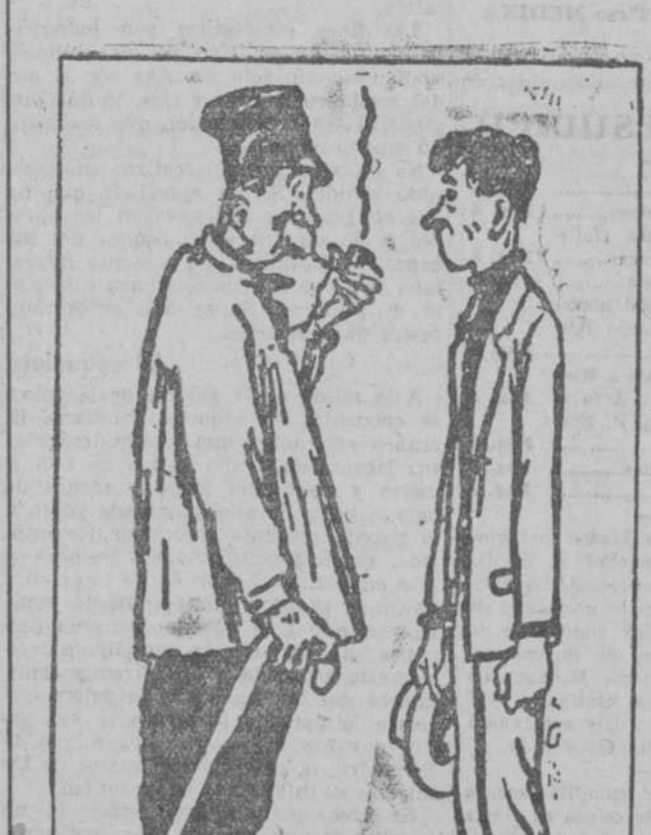
—¿Te ofreces para lechero? ¡Pero si tú no conoces el oficio! —¿Cómo que no? He estado quince años en el canal de riego. (Dorffabier, Berlín.)