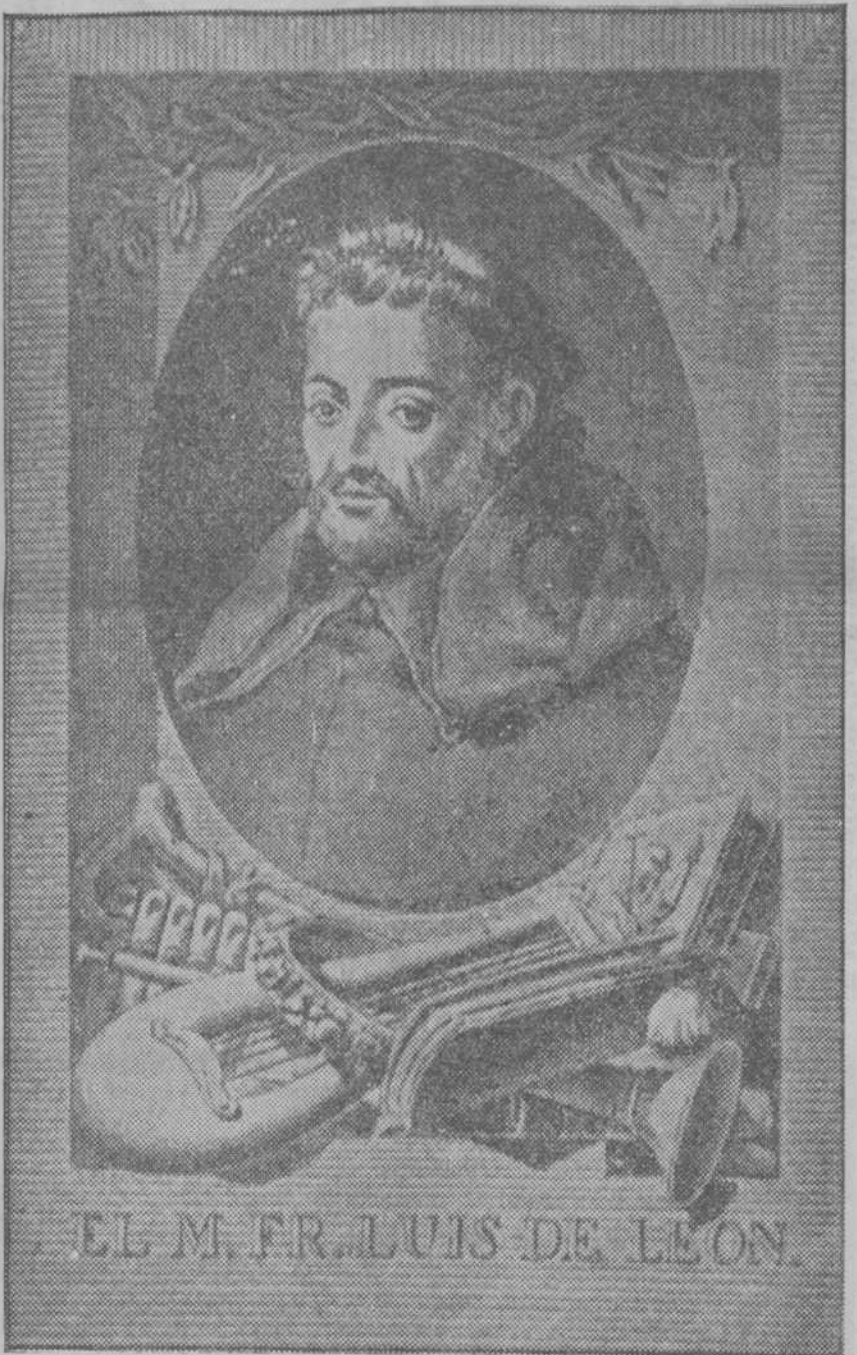
EL M. FR. LUIS DE LEÓN

Ninguna semblanza mejor para figurar al pie de este retrato de fray Luis de León que la que en su célebre "Libro de verdaderos retratos" hizo el famoso pintor sevillano, suegro de Velázquez, Francisco Pacheco. "En lo natural—dice—fue pequeño de cuerpo, en debida proporción; la cabeza grande, bien formada, poblada de cabello algo crespo; el cerquillo cerrado; la frente espaciosa; el rostro más redondo que aguilón; triángulo el color; los ojos verdes y vivos. En lo moral, el hombre más callado que se ha conocido, si bien de singular agudeza en sus dichos; con extremo abstente y templado en la comida, bebida y sueño; de mucho secreto, verdad y fidelidad; puntual en palabra y promesas; compuesto, poco o nada risueño."