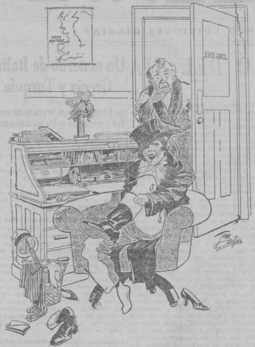
EL NUEVO DUEÑO DE LAS BOTAS DE JOHN BULL.—¿Qué bien me están!

Una vez que entre en vigor la nueva ley electoral inglesa habrá dos millones y medio más de electoras que de electores.