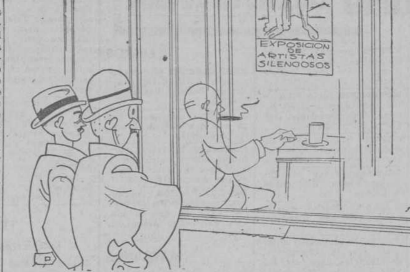
—¿Quién son los artistas silenciosos? —Pues pintores, escultores y... muchos toneros y primeras tiplés.

FELICIANO.—¿Y en Madrid, en fin, qué hará? TRISTÁN.—Hará soy y loverá. Como otras veces solía. A un niño puede igualarse. FELICIANO.—¿Pues cómo a un niño? TRISTÁN.—Que acabado de limpiar. Vuelve otra vez a ensuciarse. Si ponemos el oído a la conversación de los criaturas de Rojas Zorrilla, nos convenceremos de que ya en su tiempo había dos bandos, el de los entusiastas del clima madrileño y el de los que se atenían a la realidad. Las palabras que siguen están en la comedia Lo que son mujeres , acto II: