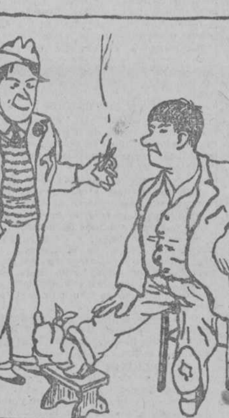
—He venido a verte porque me han dicho que se te ha caído un cajón muy pesado en un pie. ¿Cómo fué? —Porque cuando estaba cargado con él me dijo mi mujer: "Ten cuidado", y ya sabes que yo no admito que mi mujer me mande.