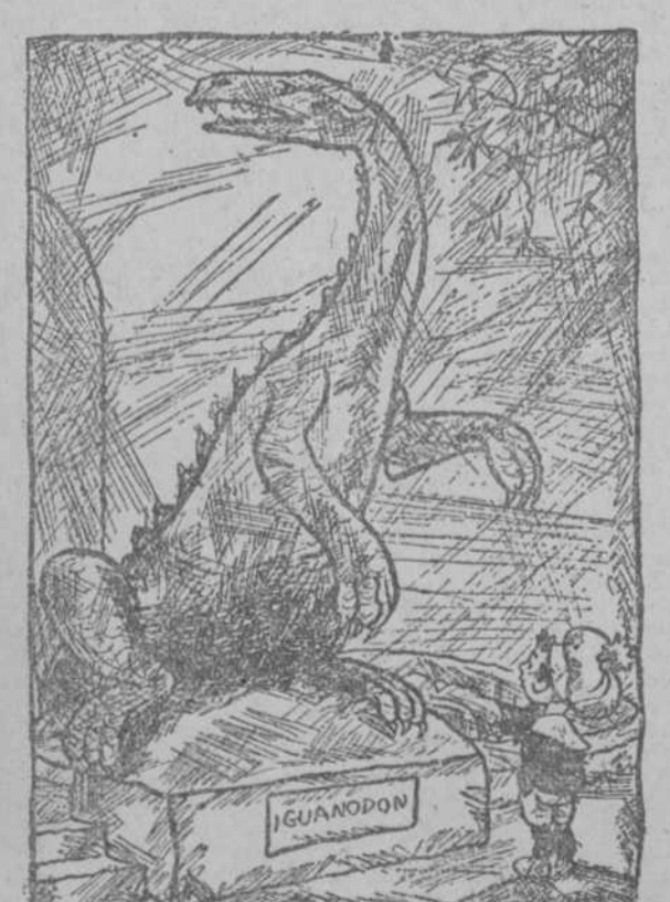
—¡Lo difícil que habrá sido enseñar a este animal a ponerse en dos patas!

No perjudica a la salud, sin yodo ni derivados de yodo ni thyrolina. Venta en todas las farmacias al precio de 8 pesetas frasco y en el Laboratorio "PESQUERA", Por correo 8,00. Alameda, 17, SAN SEBASTIAN (Cámpazco, España)