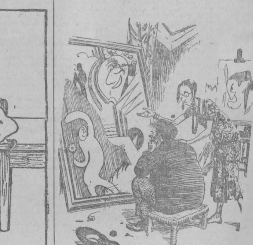
LA MUJER (al pintor moderno, a quien acaban de rechazar una obra).—No te preocupes; lo que pasa es que no lo han entendido.