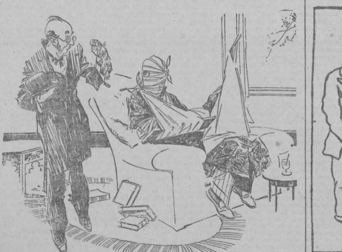
EL AMIGO CORTO DE VISTA.—¡Caramba!... No te ha sentado nada bien esa excursión en automóvil... ¡Te encuentro de mal color!