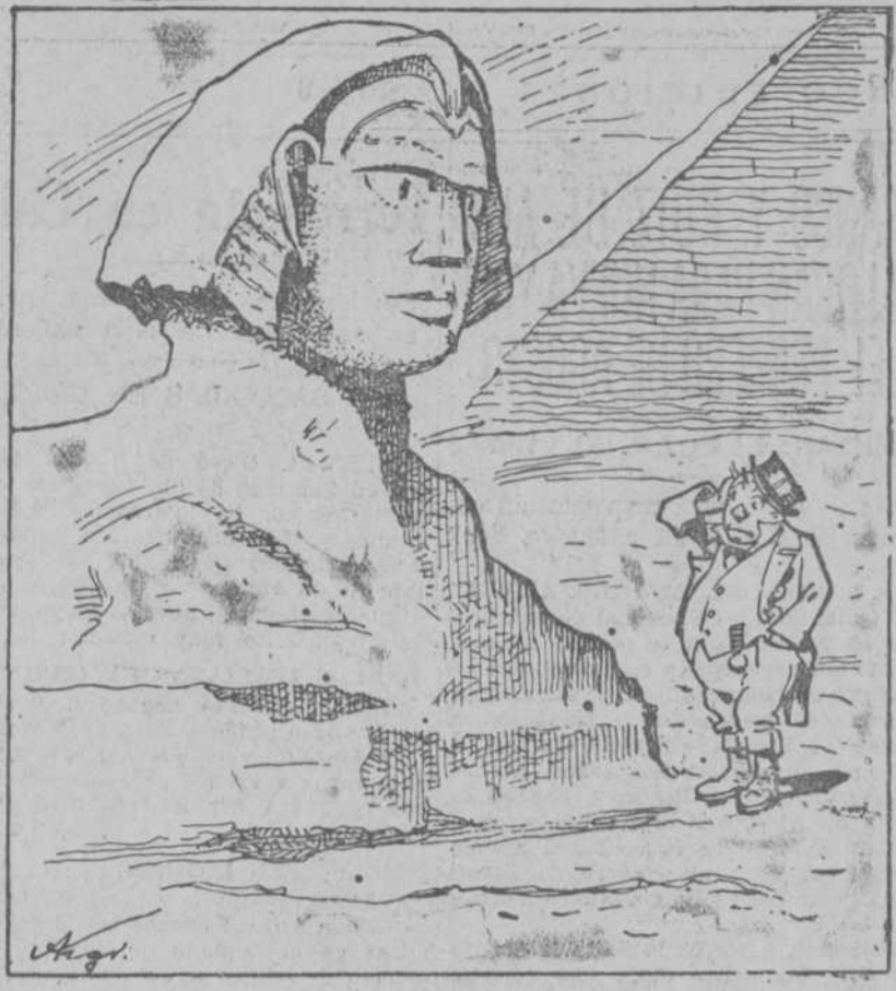
JOHN BULL.—Tú no eres la esfinge griega, pero estás dando más trabajo que aquella.

el mitin en dos casos: Primero. Si la presidencia o los responsables de la organización del mitin «le requieren para ello por escrito.» Segundo. «En caso de desórdenes graves. Si la calma se restablece, el mitin puede continuar o puede celebrarse de nuevo.» El artículo VII establece disposiciones parecidas para las manifestaciones. Salta a la vista que el delegado es inútil y que el mitin puede convertirse en una continua excitación al crimen, ya que de lo que en él se diga son responsables solamente los organizadores o la presidencia.