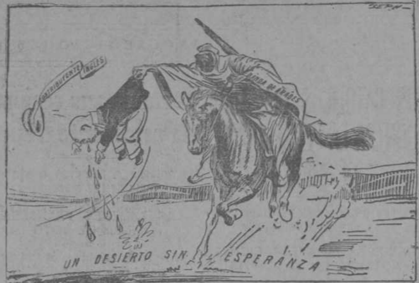
LOS BANDIDOS CAMBIAN; LA VICTIMA ES LA MISMA