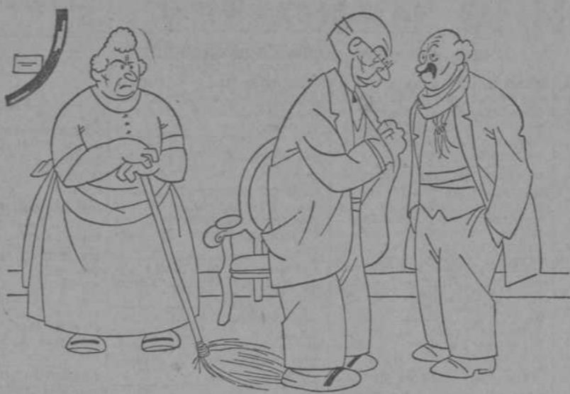
—No me gusta nada tu mujer. Debe poder más que tú. —No lo creas. Hacemos casi siempre combate nulo.