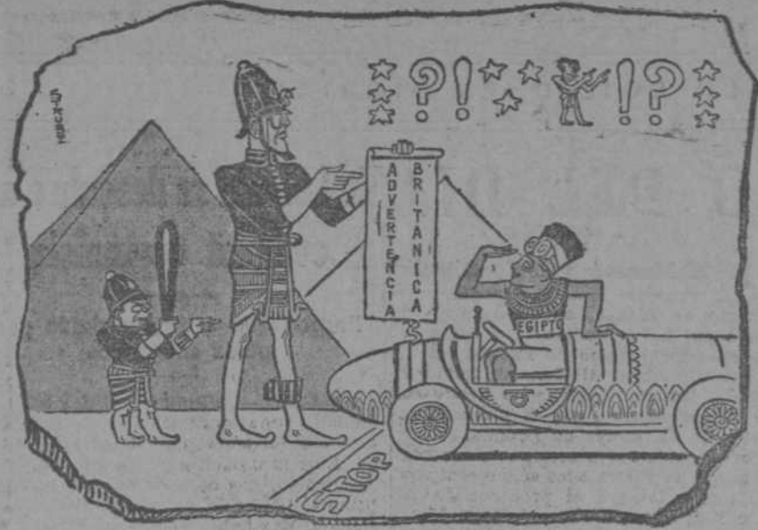
FRAGMENTO DE UN JEROGLIFICO