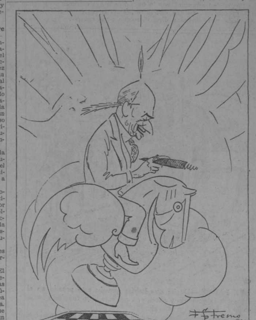
Don Jacinto Benavente visto por Fresno

«¿Quién será este señor portugués? ¿No sabrá lo que vale el tiempo? ¿Preferirá hacer de esta manera original la crítica de mi obra, de treinta y cin-