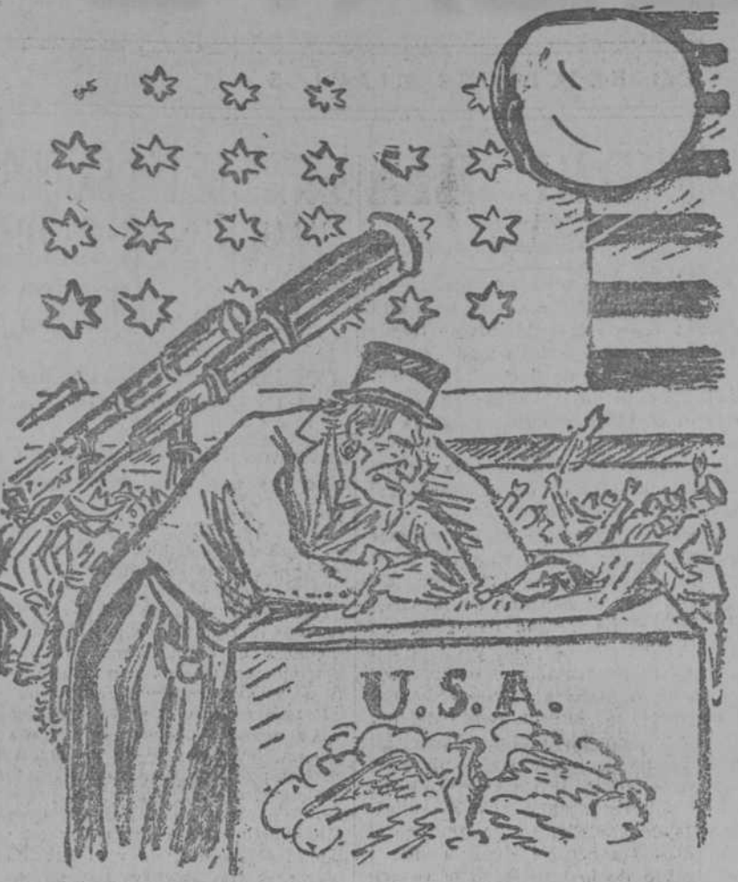
ULTIMA HORA.—La paz está en marcha. Norteamérica acaba de firmar un pacto de no agresión con la Luna.