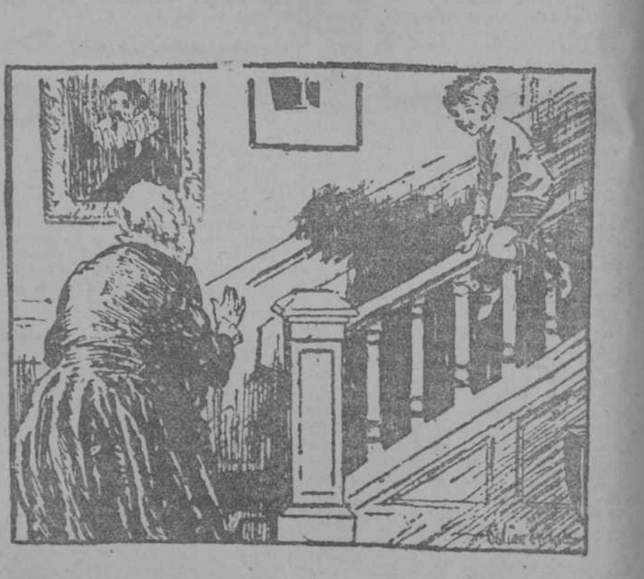
(Dimanche Illustré, Paris.)

—¿Pero qué haces, granuja? —Estoy aprendiendo equitación para que cuando sea mayor no me suceda lo que al Príncipe de Gales.