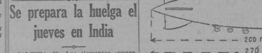
Esquema comparativo del dirigible «Los Angeles» y el portaaviones «Saratoga».