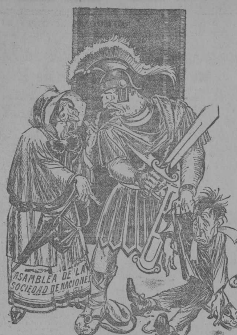
LA ANCIANA.—Usted sabe perfectamente que eso no está permitido. Nosotros hemos prohibido las guerras de agresión. MARTE.—Pero si es una guerra defensiva. Estoy convencido de que pensaba atacarme. (Glasgow Bulletin.)