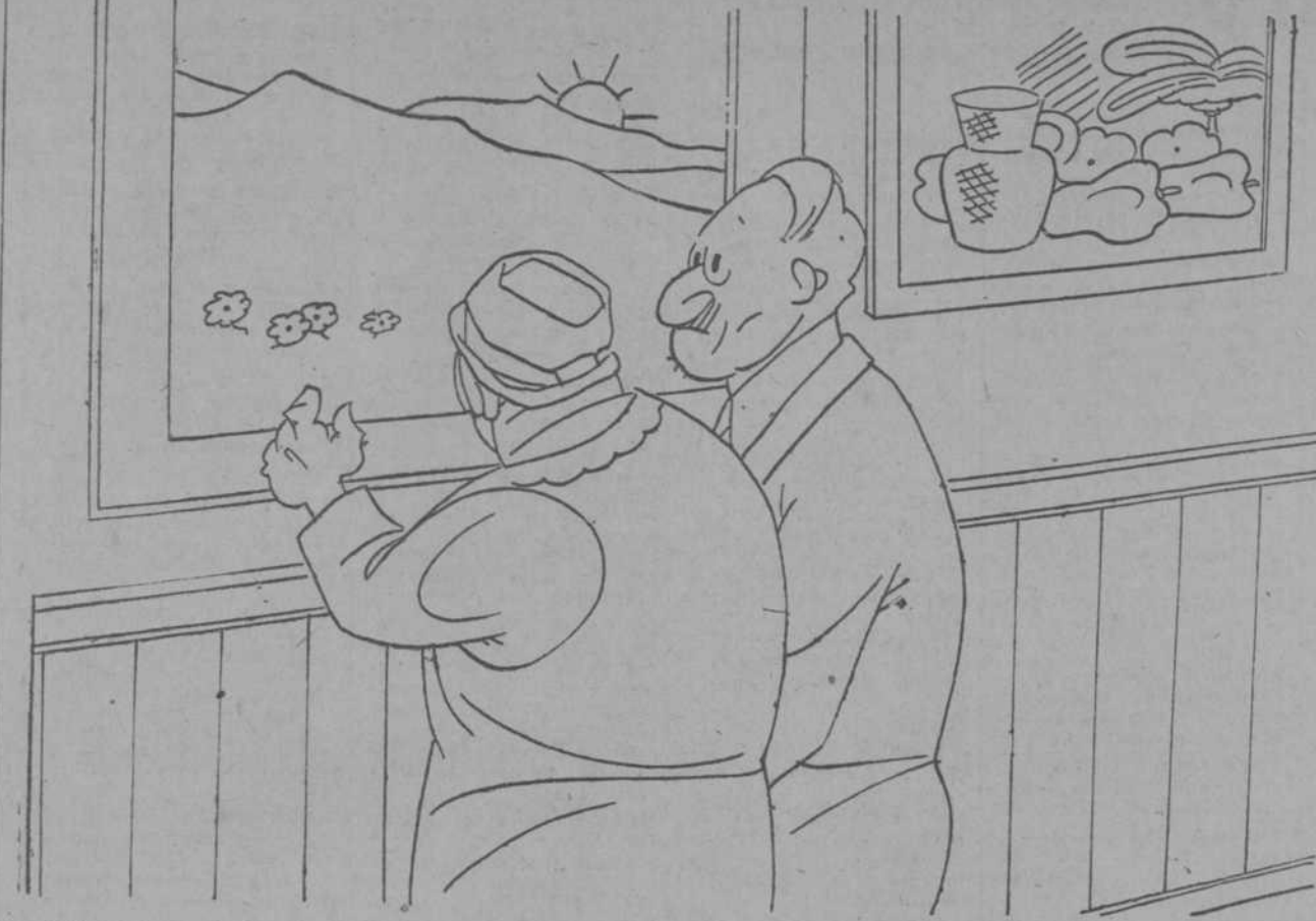
EL.—Es una tela admirable. ¡Qué dulzura! ¡Qué espontaneidad! ¡Qué sentimiento! ELLA (tocando).—Y además no debe perder.