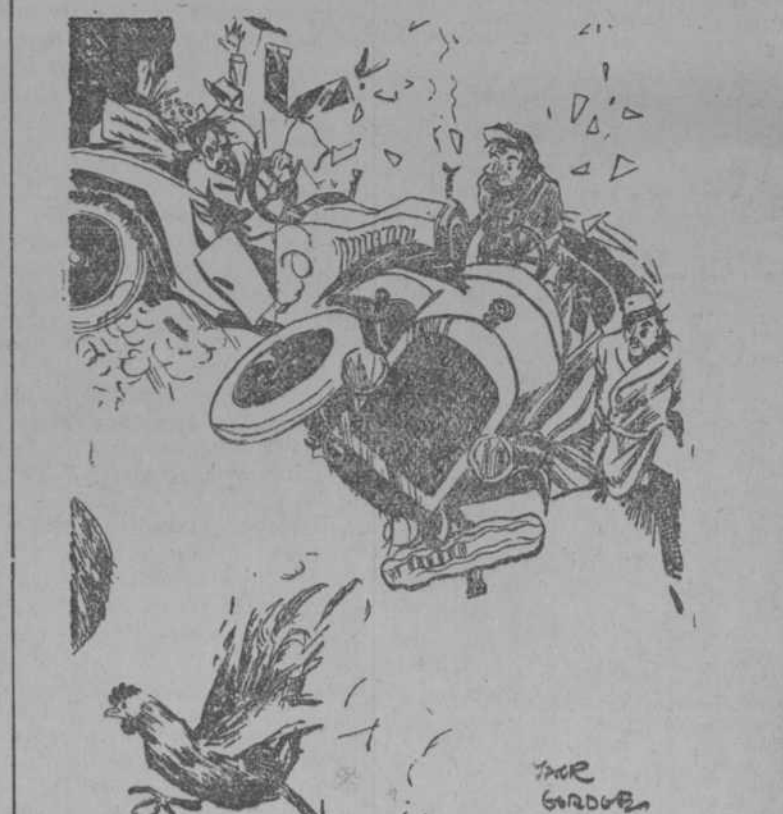
LO QUE HACE UNA GALLINA (Passing Show, Londres.)