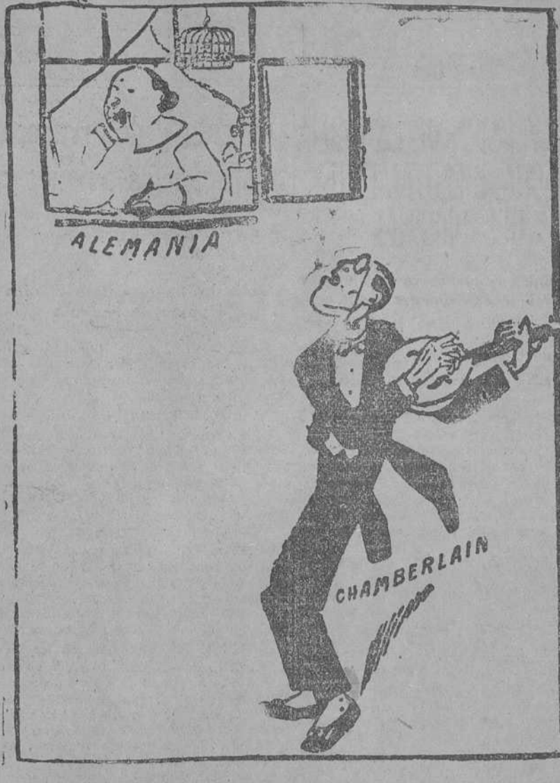
Chamberlain trata de conquistar a Alemania para que ésta coopere a la lucha contra los soviets. (De Rabotchaia Gazeta, Moscú.)