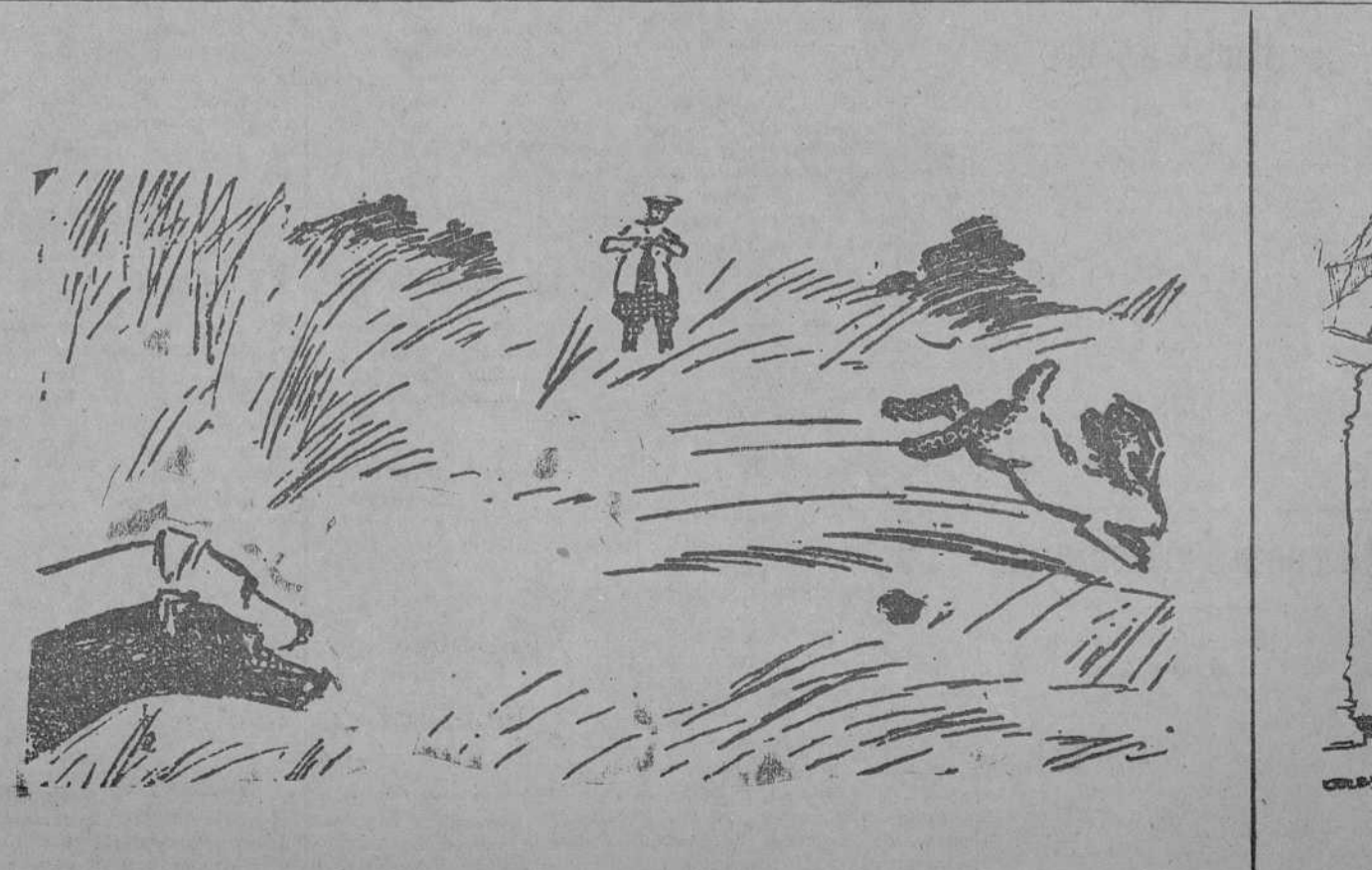
EL GALGO DE CIUDAD.—No; esa no es una liebre de verdad; las de verdad corren sobre unas ruedas. (Dublin Opinion, Dublin.)