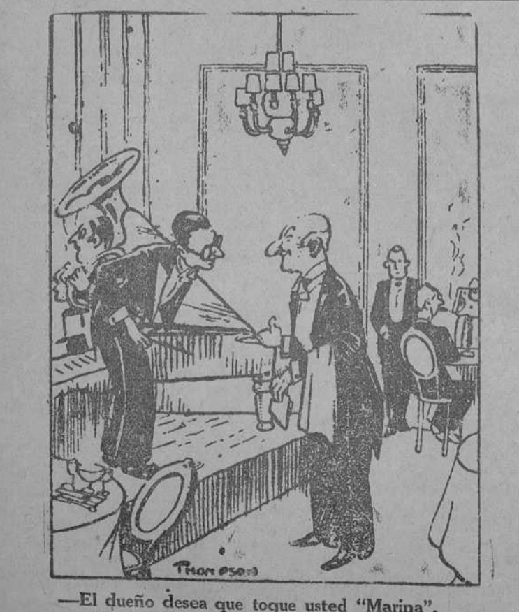
—El dueño desea que toque usted «Marina». —¿Por qué? —A ver si se anima la gente a pedir pescado, porque tenemos una merluza que se nos está pasando. (The Humourist, Londres.)

INFERIORIDAD DE LA POLICIA. «Dad a la Policía medios más eficaces! Este es el título del primer editorial del «Daily Mail». Los medios que se piden para la Policía son los conducentes a lograr la detención de los conductores que marchan a excesiva velocidad, con infracción de los reglamentos. «El problema es cada día más urgente y más importante, por el continuo aumento de automóviles en el país. No sólo hay que tener en cuenta a los criminales que emplean el automóvil para sus fechorías, sino también a aquellas personas que imprudentemente y con