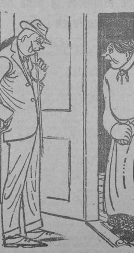
—¡Oh! Yo soy un huésped de toda confianza. Cuando dejé mi último hospedaje la patrona lloraba como una Magdalena... —¡Pobrecilla!... Pues... aquí los pagos son anticipados. (Kasper, Estocolmo.)