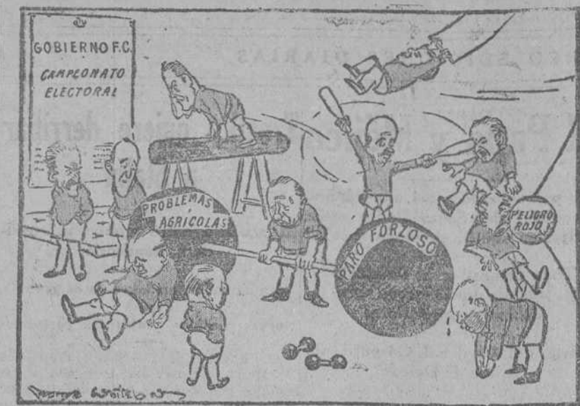
BALDWIN.—En esta preparación del campeonato, mi tarea es la más pesada. (De John Bull, Londres.)