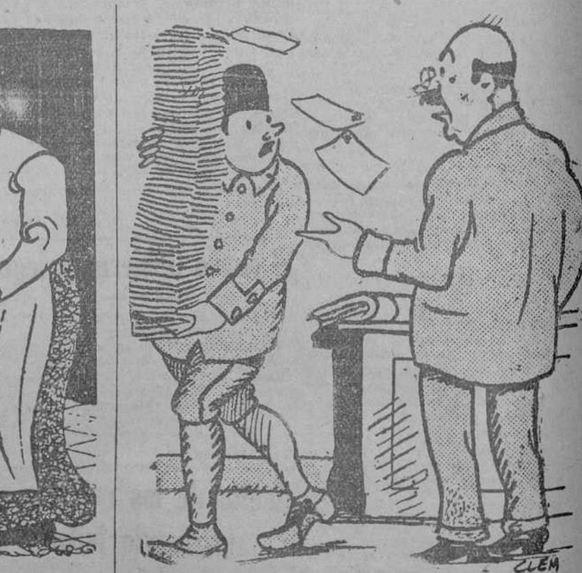
—¡A ver! Ponga usted todos esos papeles por orden alfabético y tírelos. (Pete-Méle, Paris.)