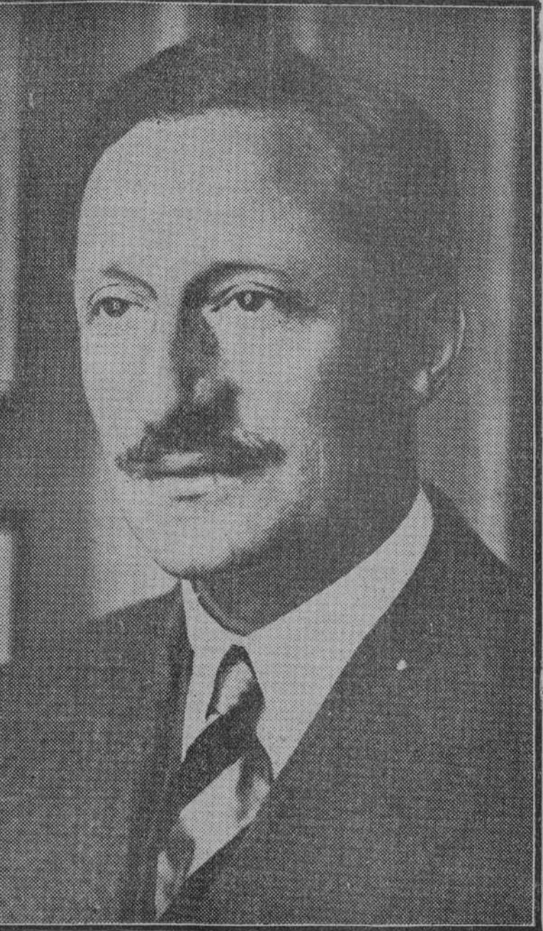
Monsieur Maurice Bokanowski, ministro francés del Comercio, que acaba de firmar el Tratado con Alemania

La figura de monsieur Bokanowski, que llegó al ministerio rodeada de gran aureola, adquiere relieve importante con la firma del Tratado comercial con Alemania. Ha sido preciso resolver grandes dificultades, y la opinión de ambos países interesados juzga muy beneficioso el acuerdo, más que por el valor práctico que indudablemente tiene, por el valor que le otorga el hecho de haberse llegado a una armonía que supone un paso de importancia en las relaciones francoalemanas. Monsieur Bokanowski, tras la firma del Tratado, ha salido inmediatamente para Norteamérica.