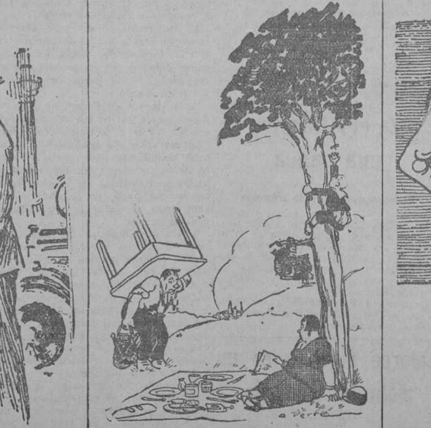
—Es una majadería que te hayas empeñado en traer esa mesa para comer sobre la hierba. —Es culpa del vino. —¿...?? —Si; es que traemos vino de mesa. (Pete-Méle, Paris.)