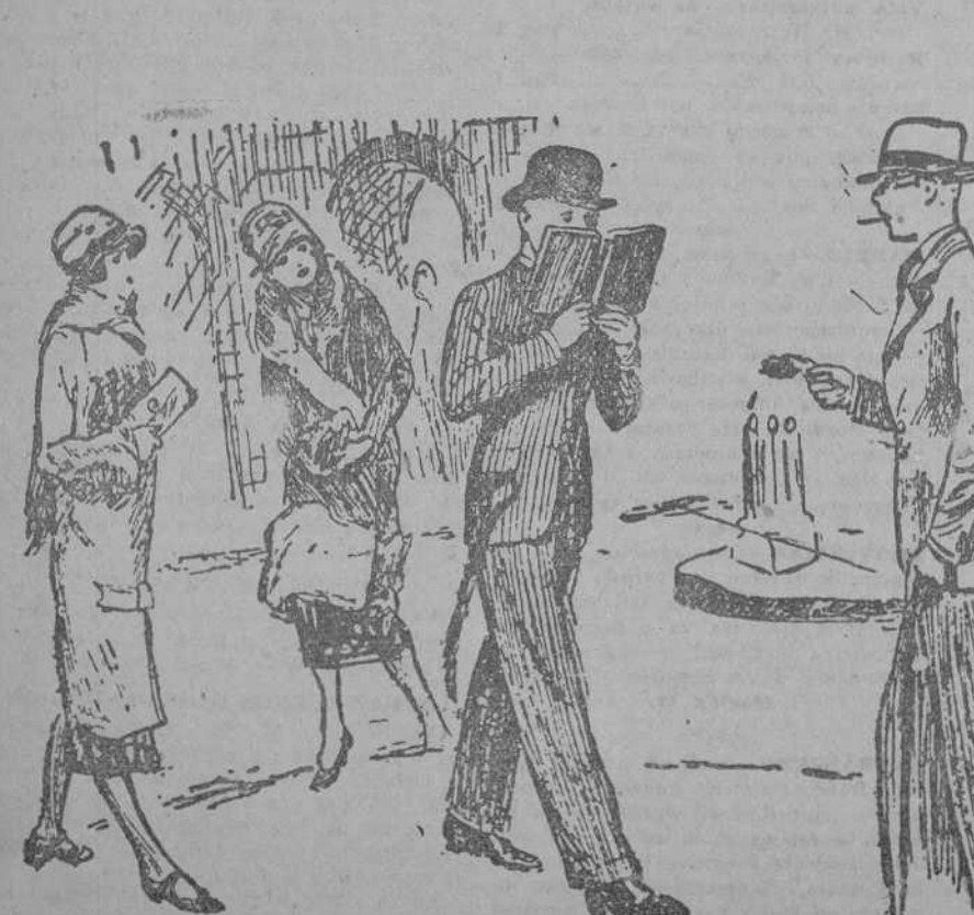
—¿Qué lees con tanto interés? —Calla, hombre; es que no he tenido tiempo de afeitarme esta mañana.

PARIS, 17.—El décimo Tribunal correccional ha condenado a tres meses de prisión al anarquista extranjero Fournier Laenet, apodado Fatty, que dirigió en Burdeos un hoja anarquista que ha de entregarse cuando se sustancie el divorcio que está planteado. La cantidad, entre muebles e inmuebles, llegará al millón de dólares.