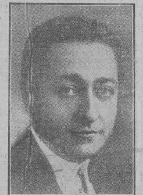
Heifetz, el mejor violinista del mundo.

El mayor elogio que se puede decir de Heifetz, su mayor mérito, a mi juicio, es que toca las obras tal como están escritas.