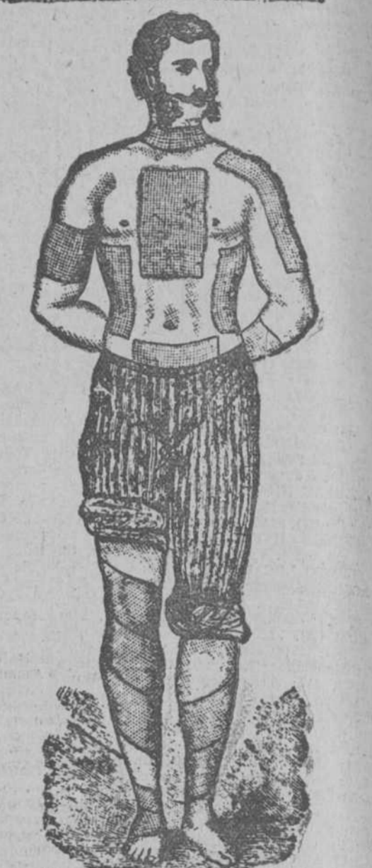
MARCA REGISTRADA Exigida en la cubierta de cada Emplastro.

Desconfíe de las imitaciones. No pida un parche poroso; pida y exija siempre un Emplastro poroso del Dr. WINTER. Es el único medicinal.