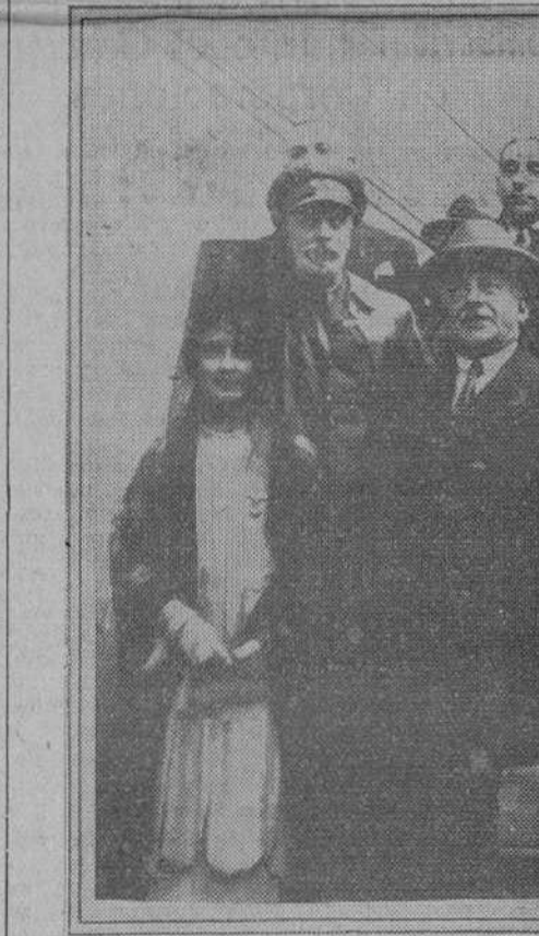
El general Frimo de Rivera con la señora de Mac-Mahon, que actuó de madrina en la inauguración del grupo de casas baratas de los ferroviarios de Bilbao