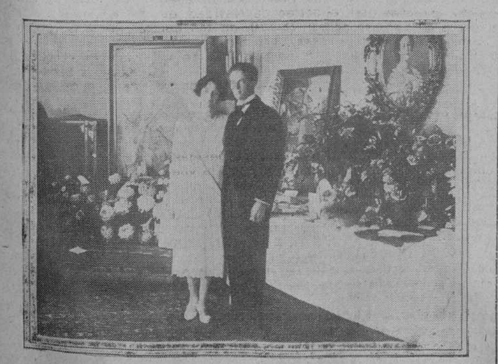
El príncipe Leopoldo de Bélgica y la princesa Astrid en el palacio real de Suecia, entre los regalos de boda que han recibido