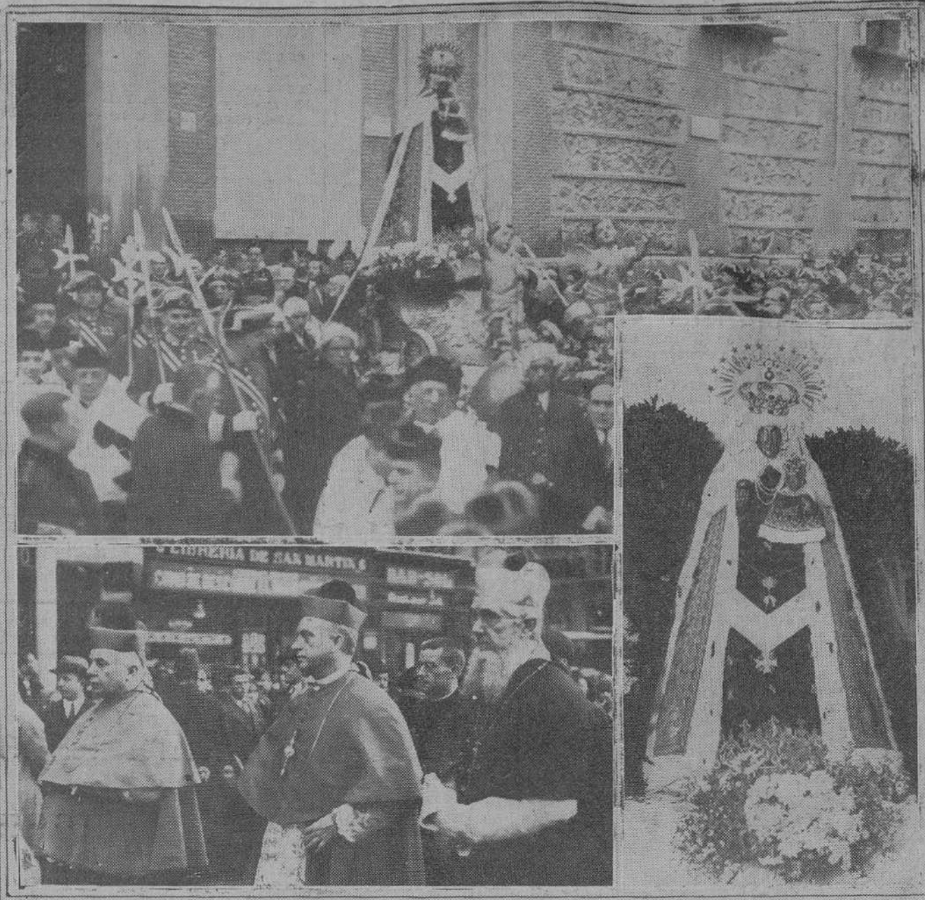
Arriba: La imagen de la Patrona de Madrid, saliendo del convento de las Descalzas Reales. Abajo: La presidencia de la procesión. En el marco, la imagen luciendo el manto, regalo de Isabel II