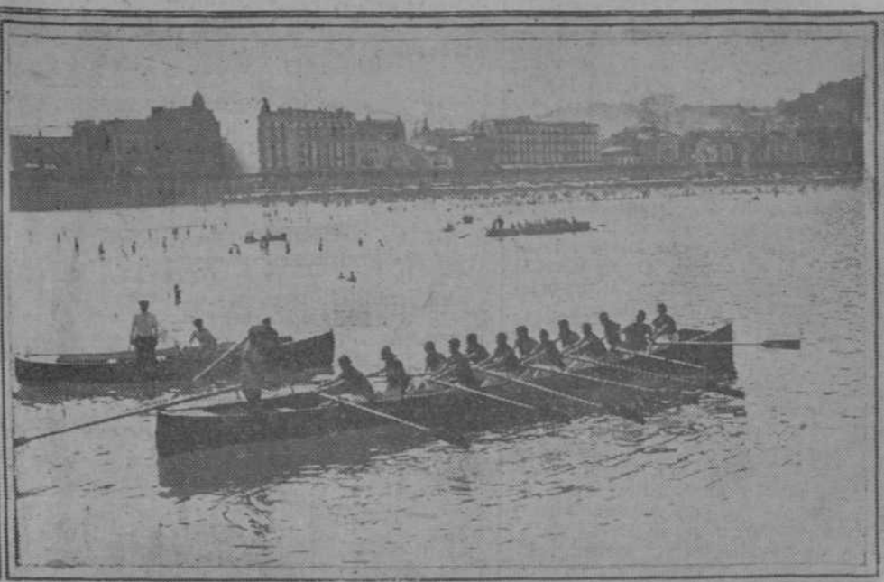
1. La Reina con el Príncipe de Gales en el Hipódromo. — 2. La trainera «Arameras», de Ondárroa, ganadora de las regatas