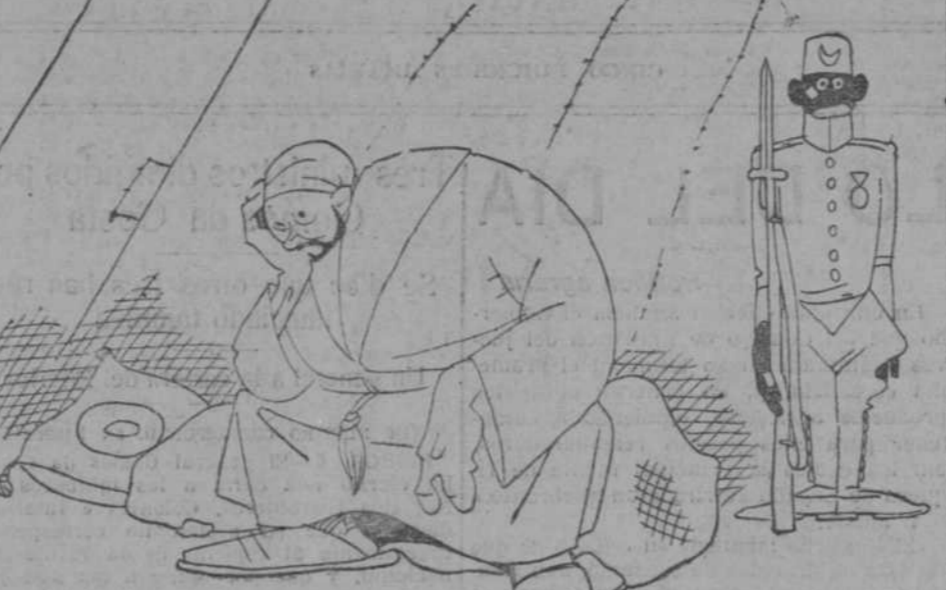
—Melilla, Madagascar, ¡cuán atormentáis mi mente!