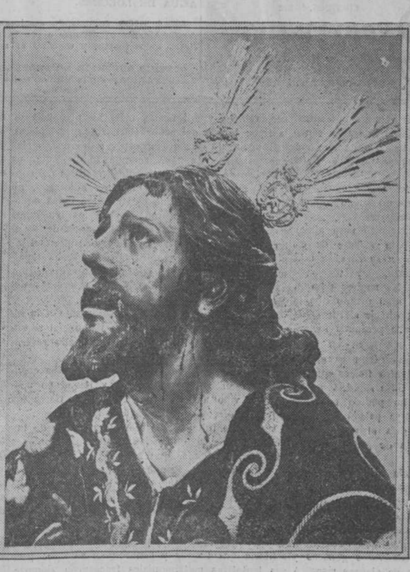
Reputada como la mejor obra de Pedro Roldán; lo más interesante del «paso» en que figura es su acertada composición, en la que destacan un bello Ángel de la Roldana y los apóstoles que duermen junto al Maestro