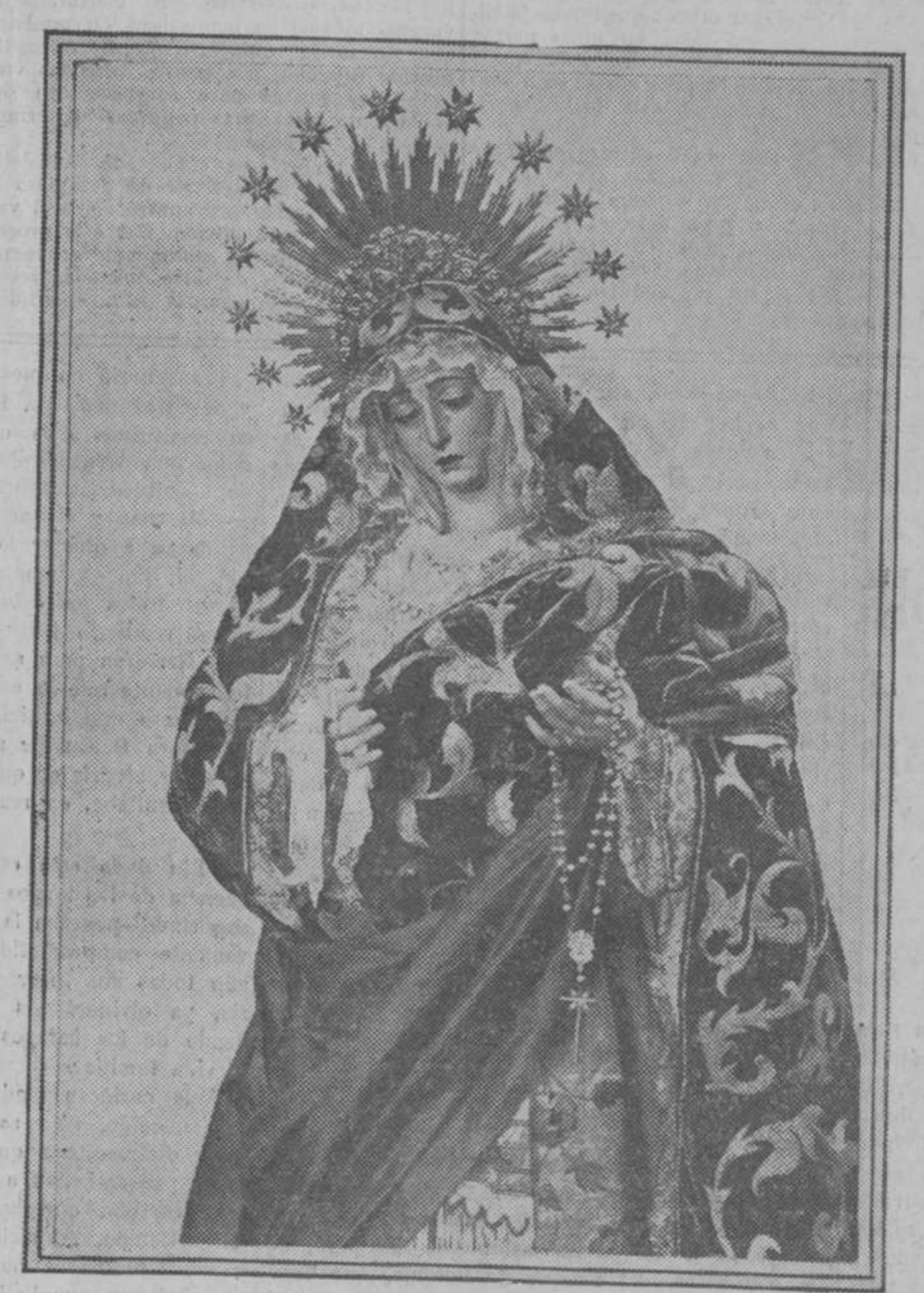
También conocida por Virgen de Montesión, del título de la capilla en que radica su Cofradía, antigua Hermandad de los patronos de Barcos. Presenta a la Virgen con manto blanco, como lo es la capa de los canzarcos .