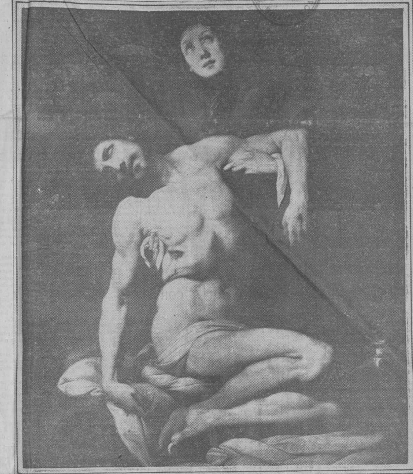
La «Pietà», de Danielli Crespi, lienzo que se conserva en el Museo del Prado

Varios periódicos italianos y extranjeros han sido invitados a enviar representantes que acompañen al presidente en su viaje. El señor Mussolini, inmediatamente de regresar a Italia, marchará a Malta, a cuya población llegará el día 20, permaneciendo en ella hasta el día 22.