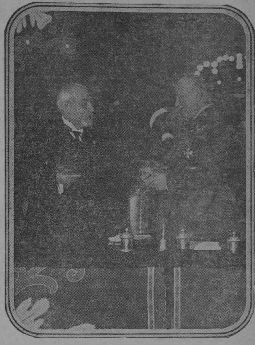
El jefe del Gobierno entregando al general Marvá la escritura fundacional del «Premio Marvá»

Preside el jefe del Gobierno que ostentaba la representación del Rey