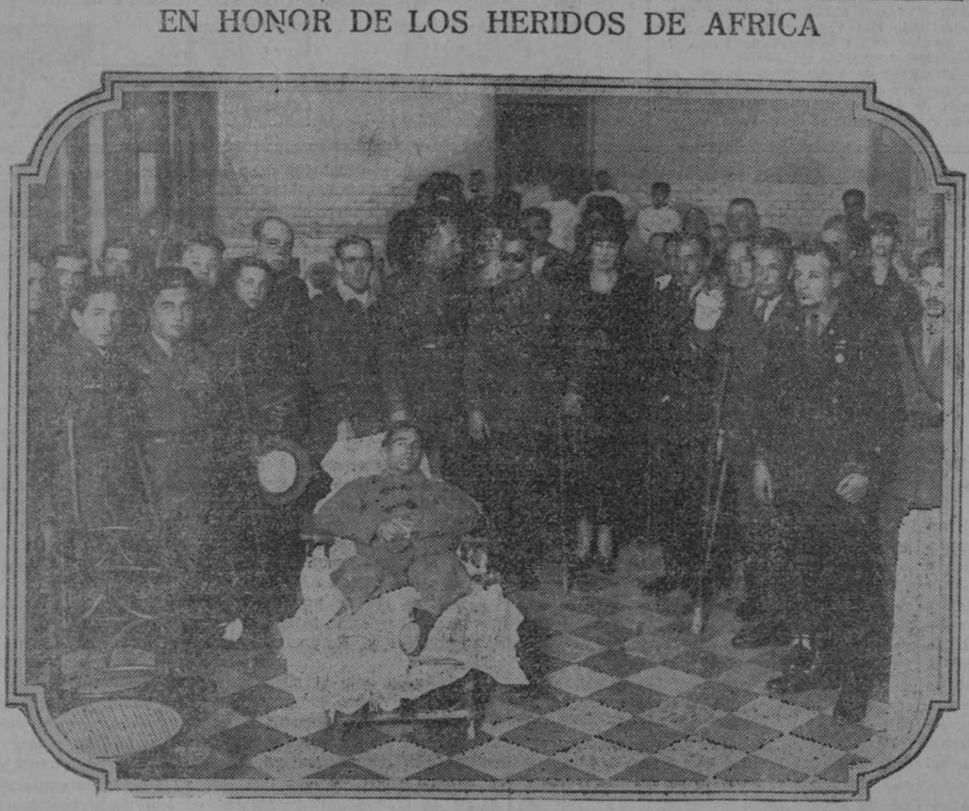
Los Reyes en la fiesta que ayer se celebró en el Hospital Militar de Carabanchel

Los Reyes en la fiesta que ayer se celebró en el Hospital Militar de Carabanchel (Fot. Vidal)