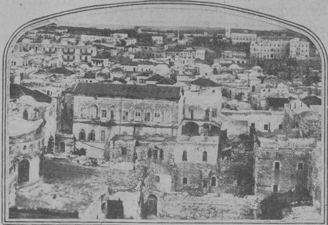
La ciudad de Belén en su estado actual