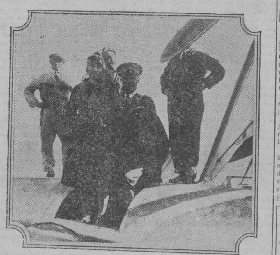
Ida Mussolini, la hija mayor del jefe del Gobierno italiano, después de su primer viaje en aeroplano