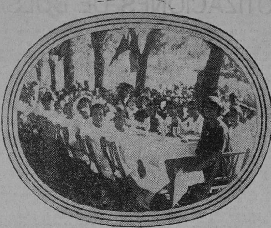
Una merienda a las niñas de la colonia en los jardines de San Antonio