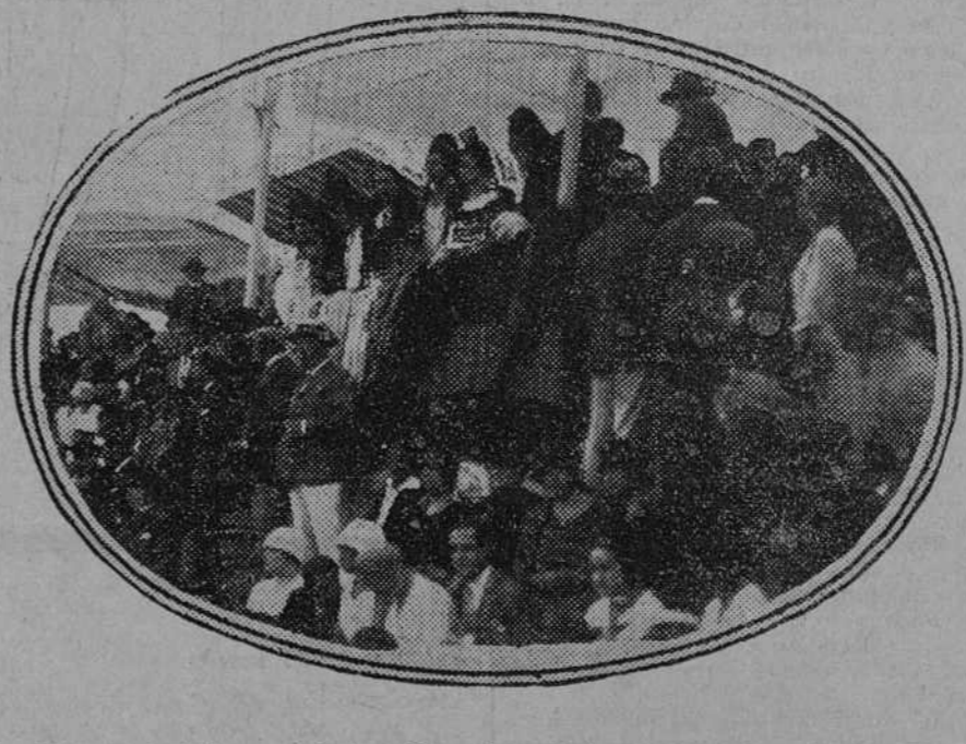
Presidencia de la becerra benéfica durante la cual resultó cogido Belmonte