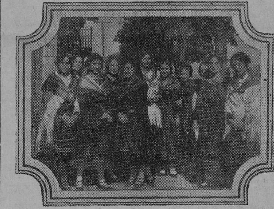
Grupo de señoritas, vestidas de segovianas, que escoltaron a su alteza durante su visita a El Espinar

Después del almuerzo organizó la expedición, que llegó a El Espinar a media tarde. El recibimiento hecho a su alteza en la simpática villa serrana fué por extremo entusiasta; en grata mezcla las mozas del pueblo y las muchachas de la colonia veraniega aparecían vistiendo el traje segoviano, tan pintoresco y gracioso. Muchas parejas salieron, en grupos al viejo estilo, a esperar a la infanta al camino, y entraron en el pueblo dando escolta a su carruaje entre los aplausos de la multitud.