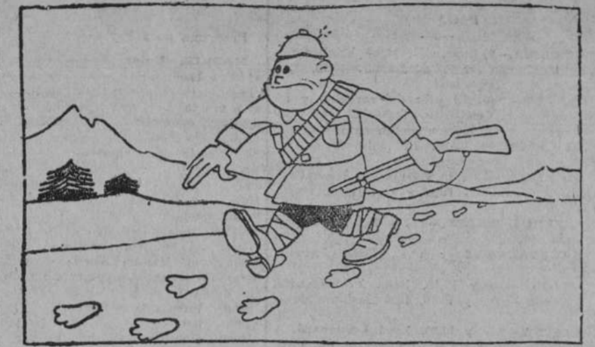
I —Hoy lo voy a cazar, porque siguiendo las pisadas lo encontraré.