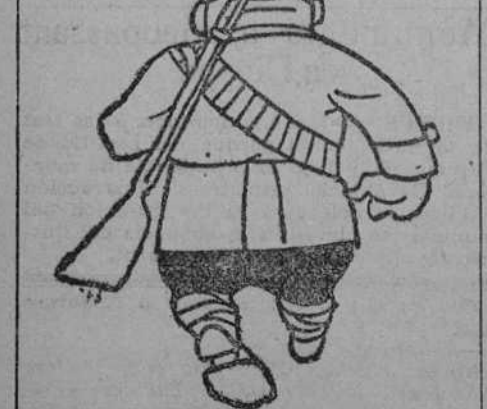
No me puedo entretener. Voy a cazar un oso en sexta plana.

Terminado el acto religioso, los niños se dedicaron al recreo por aquellas inmediaciones, y a las doce se les sirvió la comida. Por la tarde subieron en el funicular al punto más alto de la montaña, y a las cuatro emprendieron el regreso a la ciudad, a donde llegaron satisfechísimos.