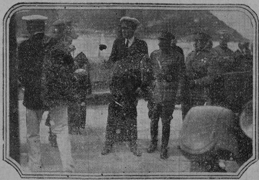
El heredero del Trono, a su regreso de Gijón, cumplimentado por las autoridades