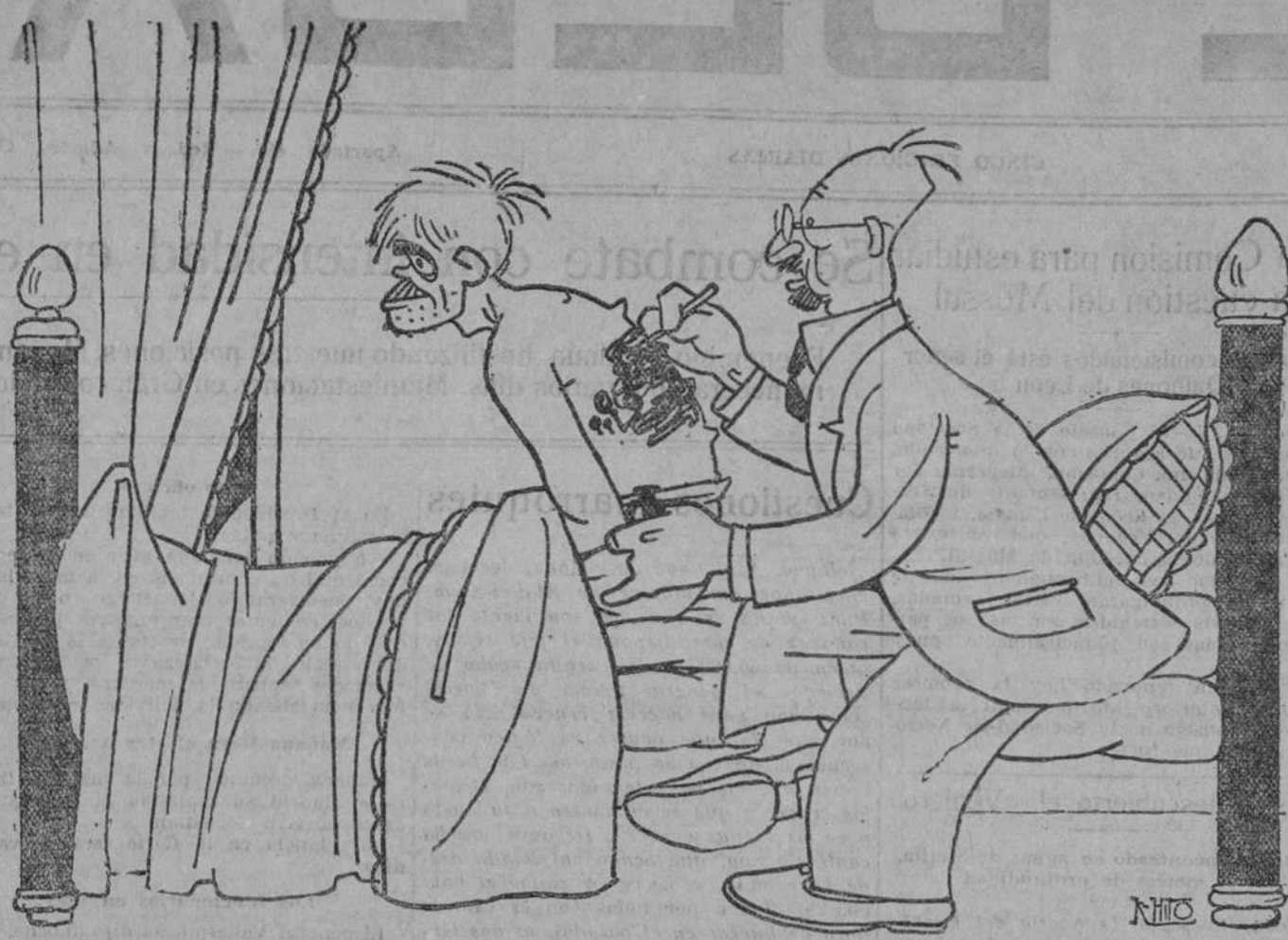
—Doctor, lleva usted dos horas. ¿No ha terminado todavía con el yodo? —¡Calle usted hombre! Me he metido a pintar un amanecer.