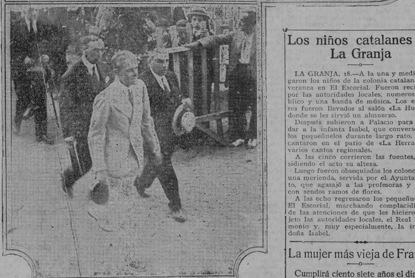
Arriba: La multitud saludando al Monarca. Abajo: El Principe de Asturias al llegar al campo de football