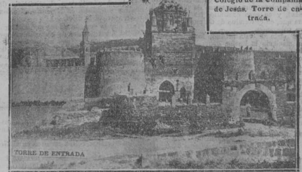
Torre de entrada