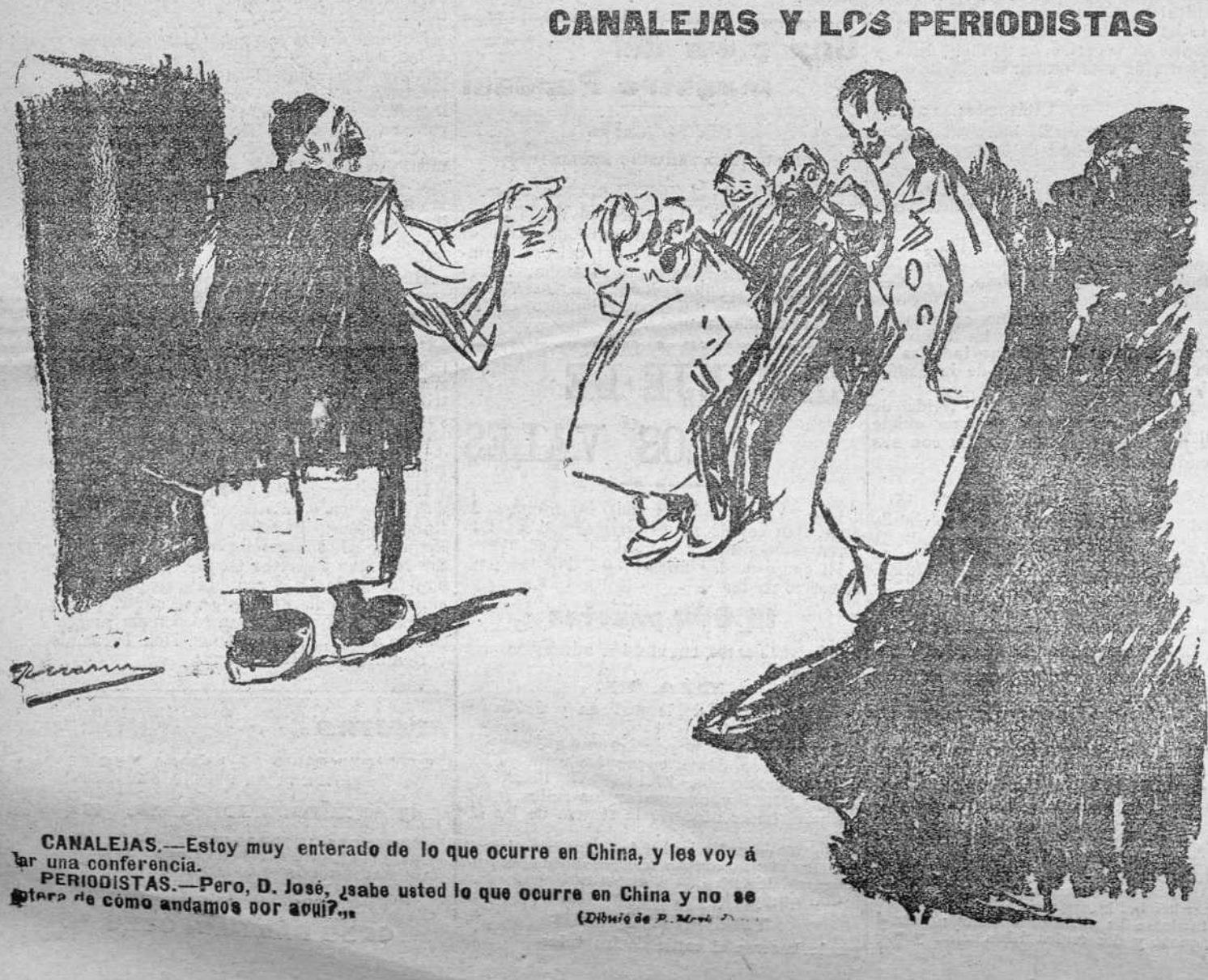
CANALEJAS.—Estoy muy enterado de lo que ocurre en China, y les voy á dar una conferencia. PERIODISTAS.—Pero, D. José, ¿sabe usted lo que ocurre en China y no se apresura de como andamos por aquí?

El secretario de la Junta dió lectura á varias cartas de distintos Prelados, en las que éstos bendicen la acción meritoria de los Jóvenes Propagandistas Católicos. Se leen también infinitas adhesiones.