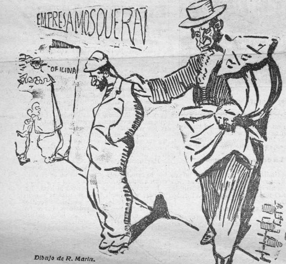
Si quieres torrear, apáñate "pa" Mosquera una recomendación de Lerroux, que sí ahora quien corta el bacalao, ó el amo del cotarro.