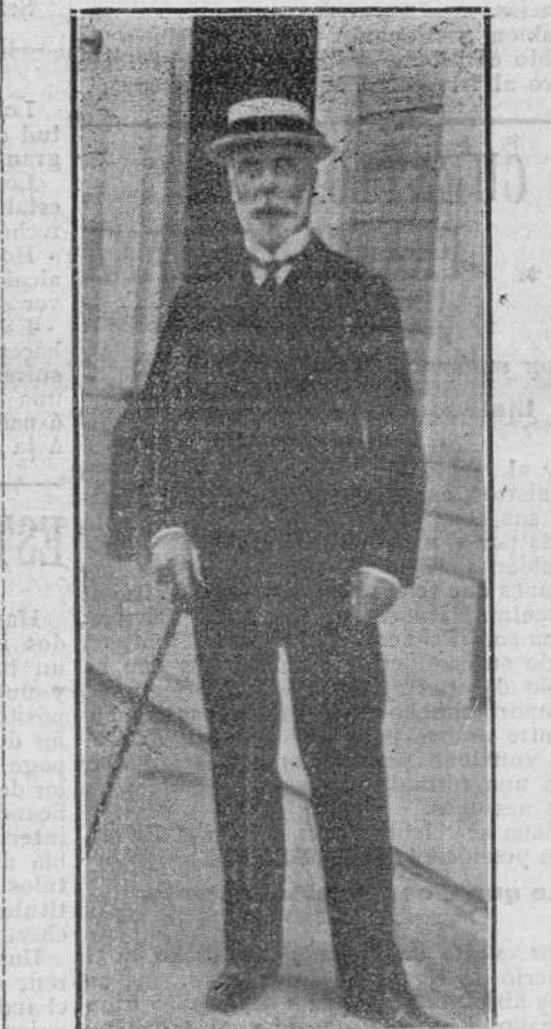
El embajador de Inglaterra, que fué obsequiado ayer con un banquete por la colonia inglesa.

Las Perches noires d'Amérique son tan sabrosas al paladar como las carpas de mesa.