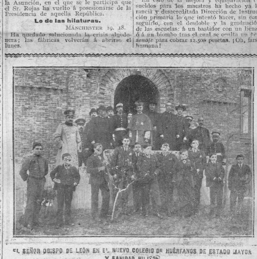
EL SEÑOR DISPO DE LEÓN EN EL NUEVO COLEGIO DE HUÉRFANOS DE ESTADO MAYOR Y BANDAS MILITARES