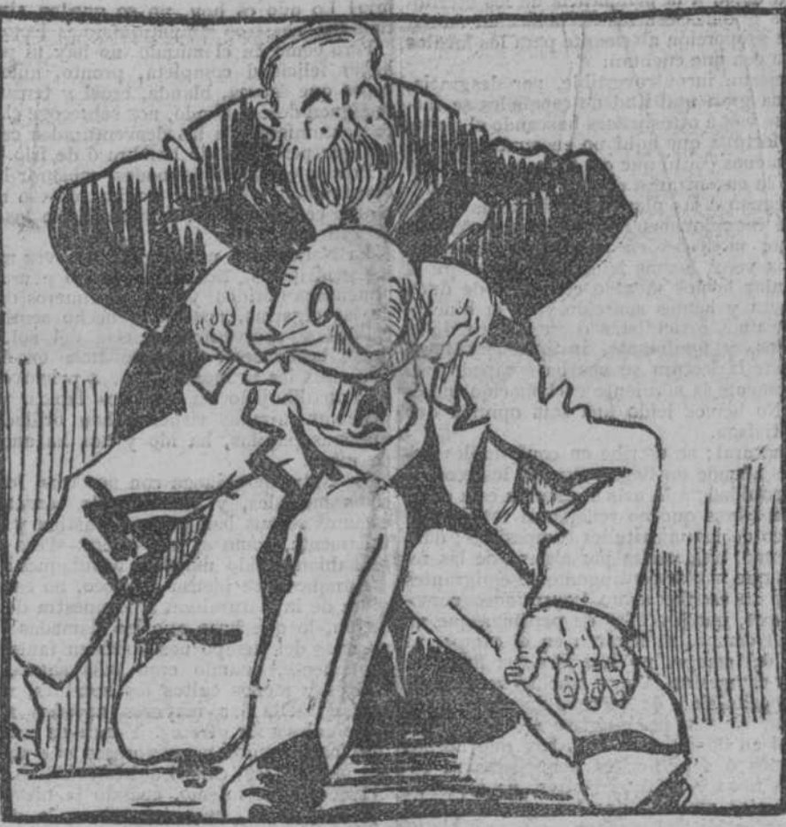
—¿No queríais caldo, mandilones? Pues tomad siete tazas.