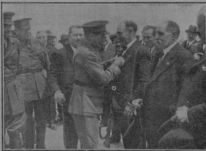
Solemne imposición, por el capitán general de Cataluña, de las medallas de Constancia a los somatenistas que llevan en la Institución de veinte años para arriba.