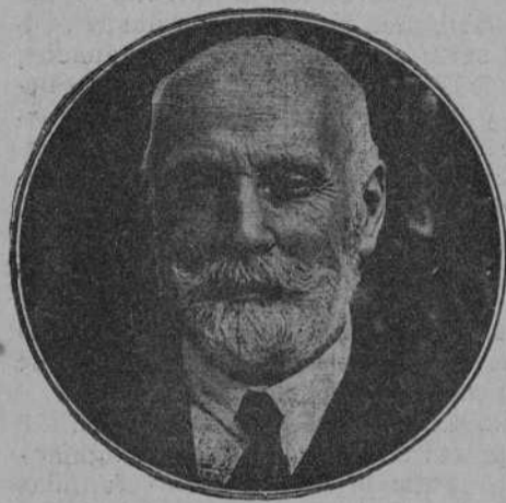
Don Armando Palacio Valdés, el glorioso novelista español, para quien se pide el Premio Nobel de Literatura de este año.

«Su Majestad la Reina Cristina me ha llamado esta mañana para encarecerme con toda sinceridad agradezca a vuestra excelencia la iniciativa de organizar un homenaje a ella de todos los Ayuntamientos de España; pero al mismo tiempo pide con vehemencia y apremio que no se haga nada en tal sentido, pues quiere vivir en modesto apartamiento y dejar que toda su aureola ilumine la figura de su hijo el Rey Don Alfonso XIII. Ha sido tal su empeño de que así lo telegrafe en seguida, que aun pareciéndome un acierto de V. E. la iniciativa, he de interesarle la suspensa hasta que en muy próximo día tengamos ocasión de conferenciar.»