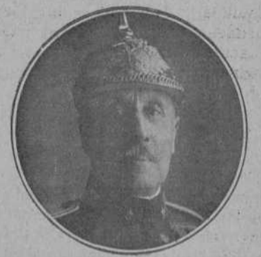
Don Julio Ardanaz, que era capitán general de Madrid, y que ha sido nombrado presidente del Tribunal Supremo de Guerra y Marina.

El Tesoro colonial dispone de recursos suficientes para la realización de estos proyectos, y el Gobierno está resuelto a no levantar mano hasta llevarlos a cabo, apelando a todos los medios para lograrlo.»