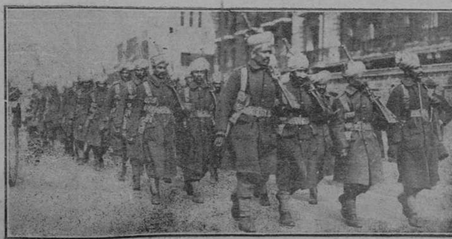
Shanghai.—La primera expedición de tropas británicas llegadas de Hong-Kong, desfilando, al desembarcar, para alojarse en el Hipódromo.