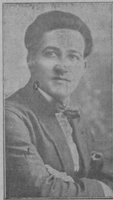
Miguel Fleita Tenor