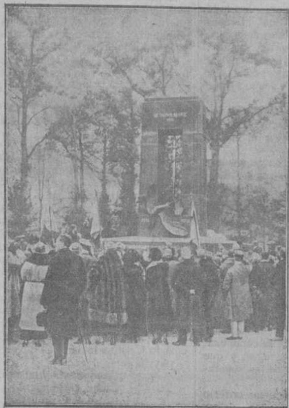
Inauguración del monumento erigido en Compiègne, donde se detuvo el vagón que conduca al generalísimo Foch, para aguardar a la Comisión Militar alemana que firmó el armisticio

Con esta ocasión se piensa constituir la magna Asociación de la Prensa hispanoamericana.