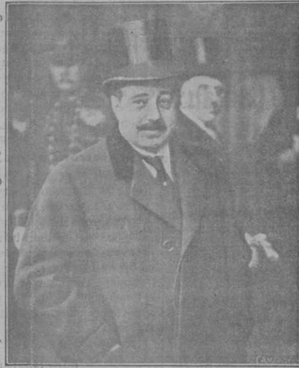
Sr. Quiones de León, representante de España en el Consejo de la Sociedad de las Naciones.

El proyecto prevé asimismo la exhibición de películas para la juventud, que serán proyectadas con el vistoso de una Comisión compuesta de tres miembros nombrados por el ministro.