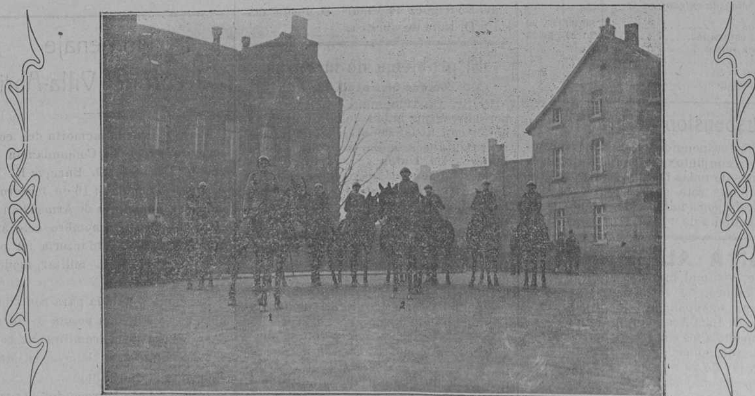
El general Michel (1), el general Coppejaus (2) y el Estado mayor del ejército belga de ocupación, en Alemania

Sostiene el periódico que la solución propuesta por los yugoslavos constituiría una amenaza constante para Italia y para la paz, mientras que si se diera satisfacción a las reivindicaciones de Italia quedaría garantizada en el porvenir la tranquilidad de Europa.