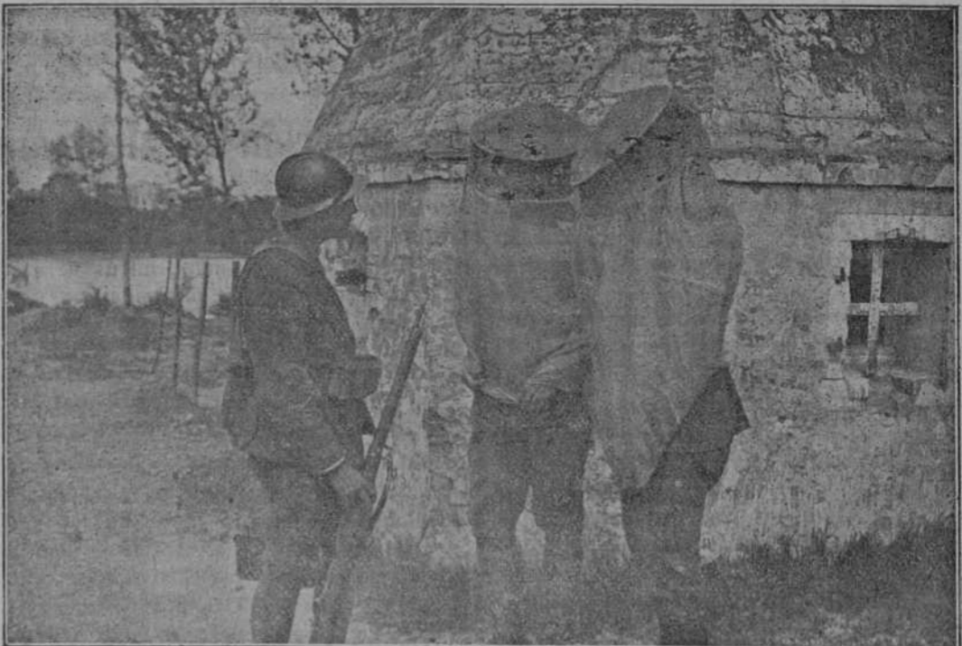
Escafandras aéreas contra los gases asfixiantes, usadas por los italianos en la guerra.

Notorios son los progresos realizados en el orden industrial y comercial, y donde más palpablemente se denota es en lo relativo al fomento de la Marina mercante; y lo más notable es que sin haber recibido ningún apoyo oficial efectivo, las industrias marítimas, que son las que nos ponen en contacto con el mundo entero y llevan nuestras actividades y producciones a los últimos confines del planeta, han progresado extraordinariamente.