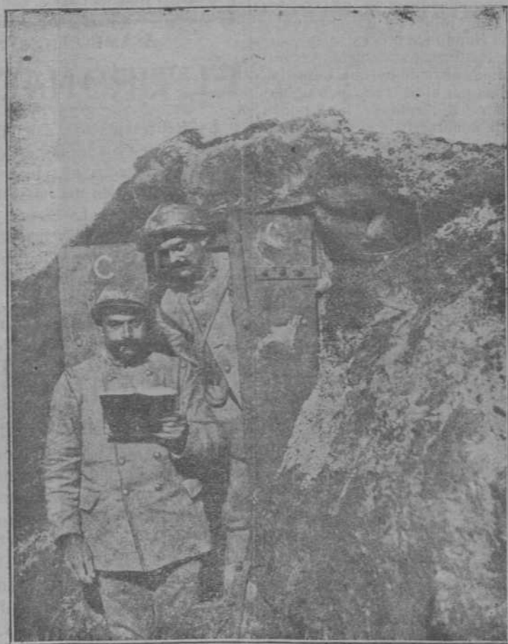
Observatorio blindado, en primera línea, sobre la meseta de Vanclere, en el Aisne.