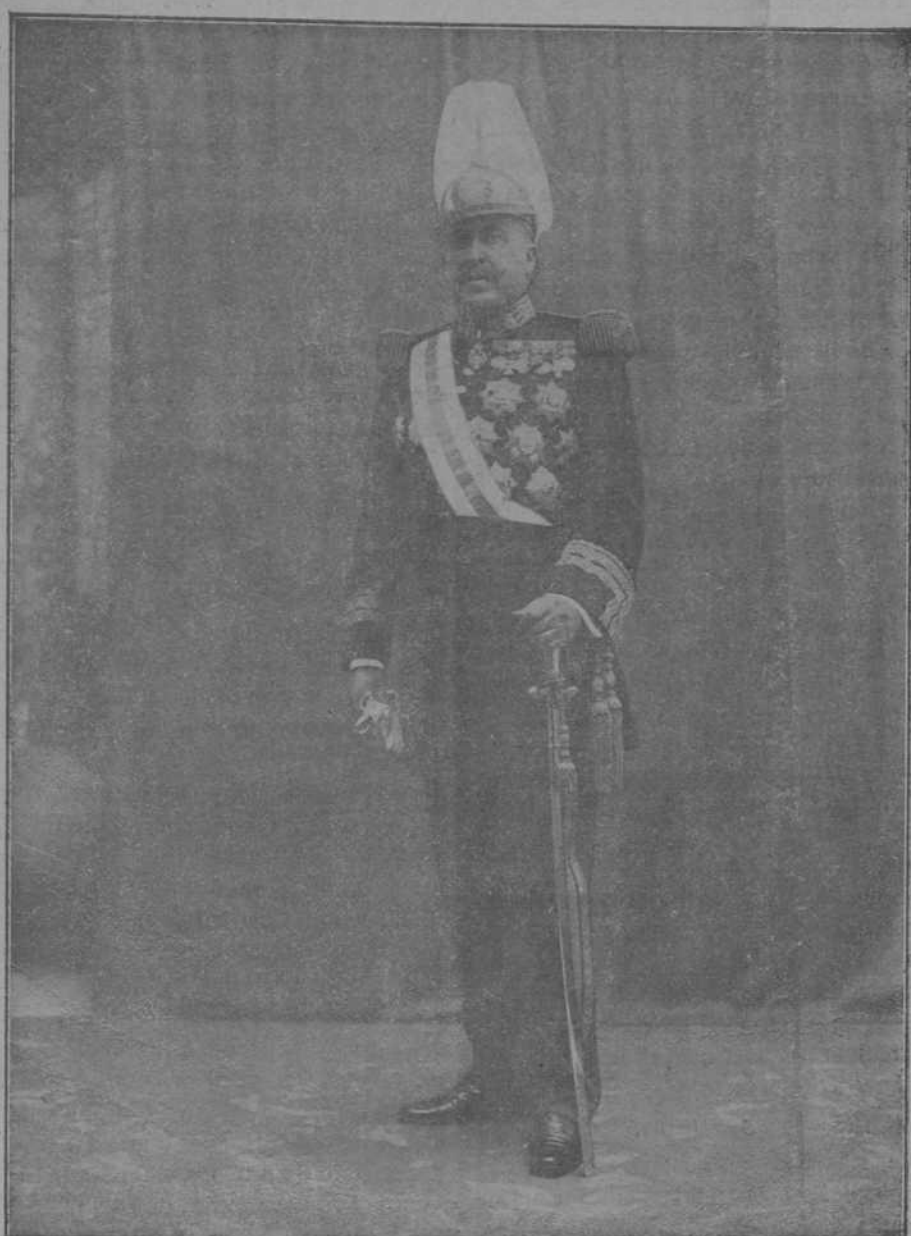
El Excmo. Sr. D. Francisco Aguilera y Egea, ministro de la Guerra.

Tenerife, 1.º.—Procedentes de la Habana han llegado 173 braceros canarios, que tuvieron que abandonar el trabajo por la intranquilidad que reina en los campos de Cuba con motivo de la revolución. En breve se espera otro gran buque de emigrantes.