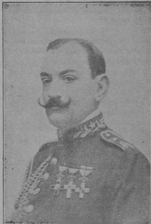
El conde de Coello de Portugal.

Al llegar a Avila los alumnos procedieron al desembarque de todo el material con rapidez prodigiosa, dirigiéndose en dos secciones, una de tropa y otra con materiales y carros, por las calles de la población hasta la Academia.