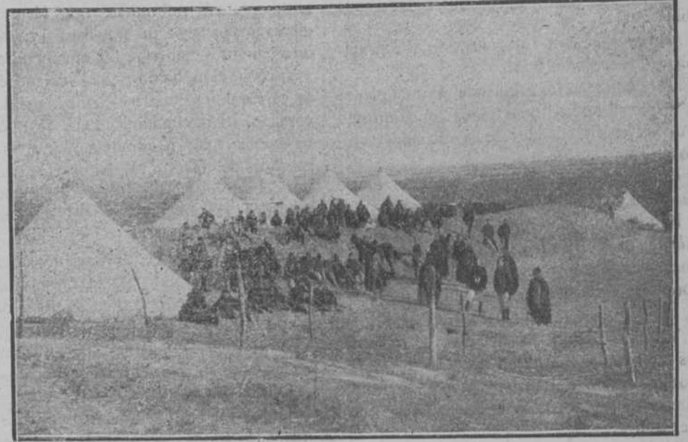
MARRUECOS.—CAMPAMENTO DE MALALIEN