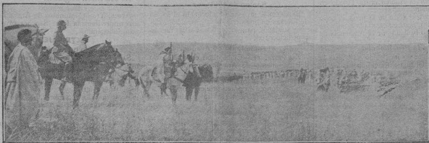
Marruecos: El general Silvestre presenciando un combate.

La agitación en Ayamonte é Isla Cristina es grandísima, lo mismo que aquí.