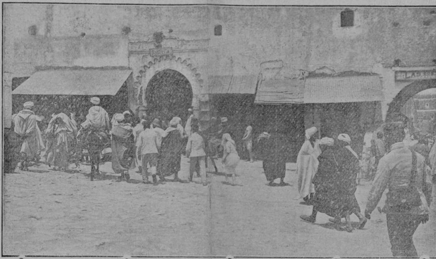
MARRUECOS: PUERTAS DEL ZOCCO DE LARACHE

LONDRES, 30.—La Prensa yanqui recoge las censuras que ha motivado la gestión de Lind en Méjico, y, concretamente, la promesa que