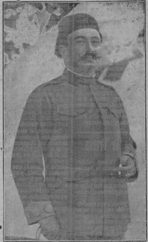
El general D. Dimaso Berenguer Fusté.

El Success no es el vapor más antiguo que existe actualmente.