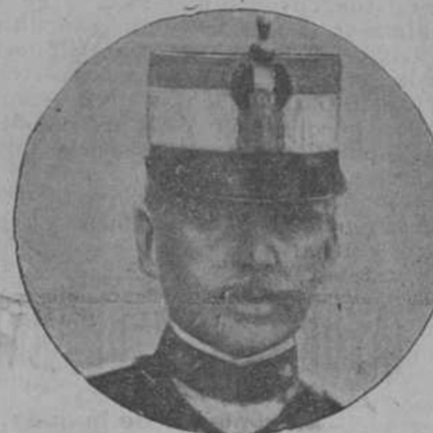
El comandante D. Armando Mantilla, ayudante del General Primo de Rivera, muerto heroicamente.

medio día para atender á esta necesidad, arrojó de tal manera el fuego de los enemigos, que se hizo imposible debilitar aquellas posiciones.