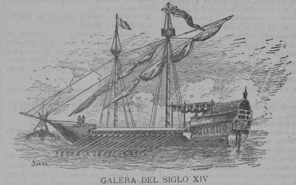
GALERA DEL SIGLO XIV

Anteayer se recibió noticia en los Centros oficiales de haber sido hallado en el kilómetro 70 de la línea del Ferrocarril Cantábrico, entre las estaciones de San Vicente de la Barquera y Pesués, el cadáver de una mujer completamente desnuda, cuyas ropas se en-